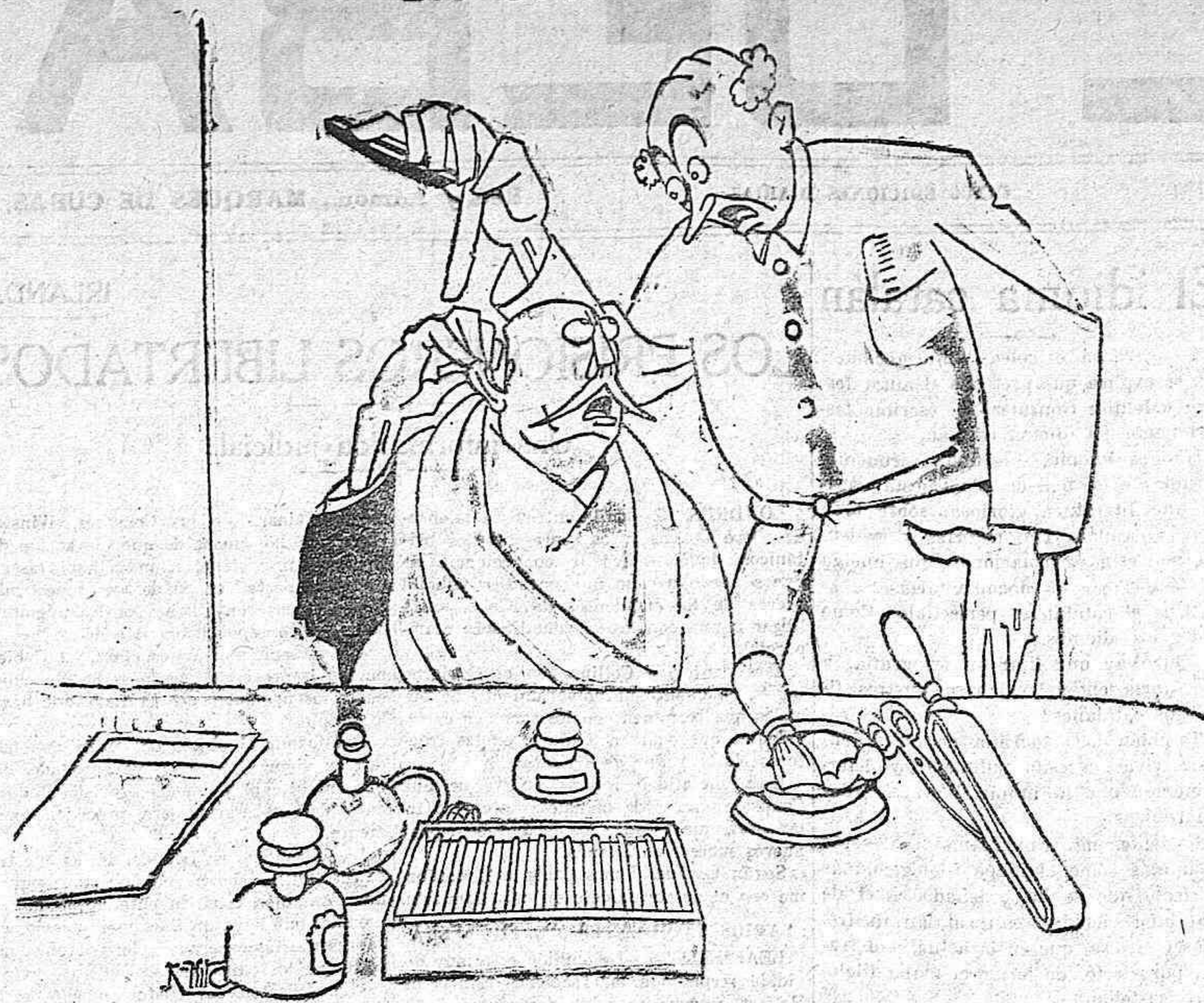
—¡Por Dios, maestro, que la faena no ha sido como para cortar la oreja!