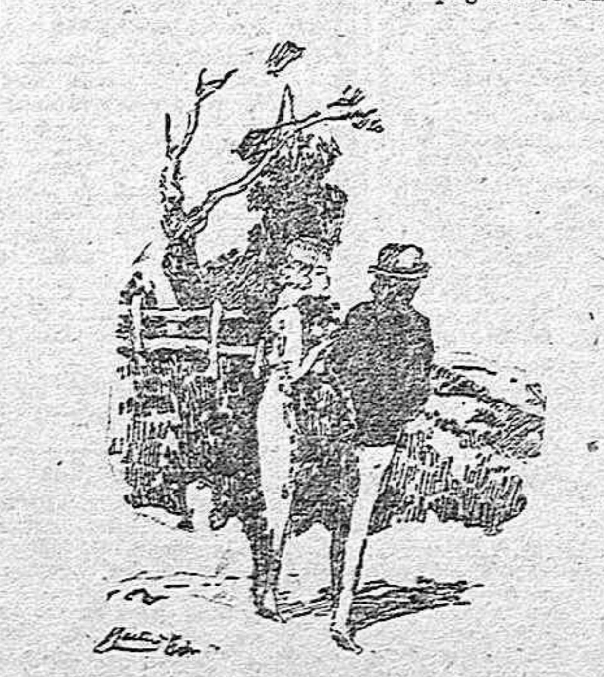
—Eso runca!—dije con dignidad.

alguno de sus criados y sobornar a su doncella para hacerle llegar mi mensaje?—añadió. —¡Eso runca!—dije con dignidad. —¿Qué hacemos entonces? Compaginemos las