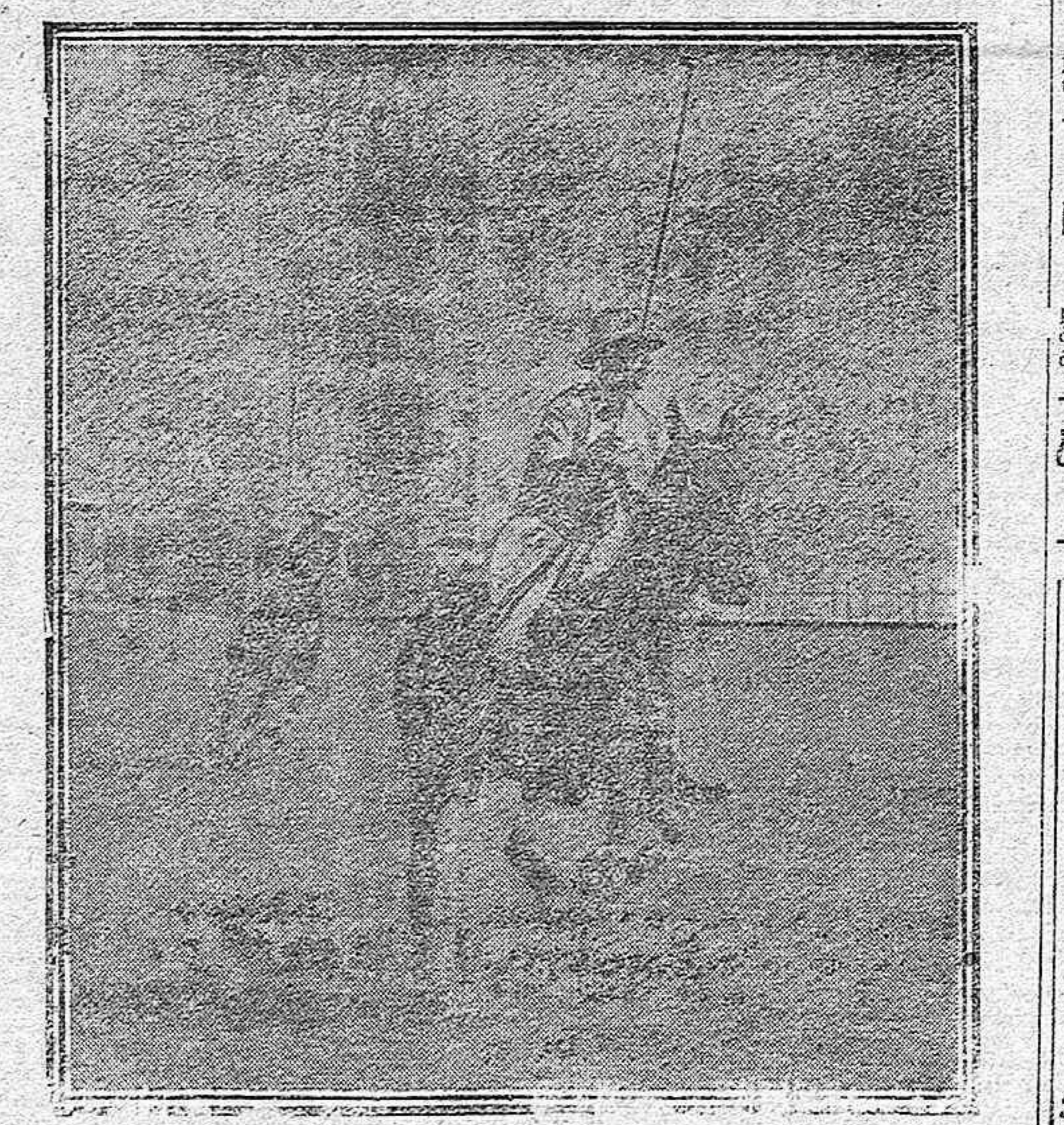
SU MAJESTAD EL REY.