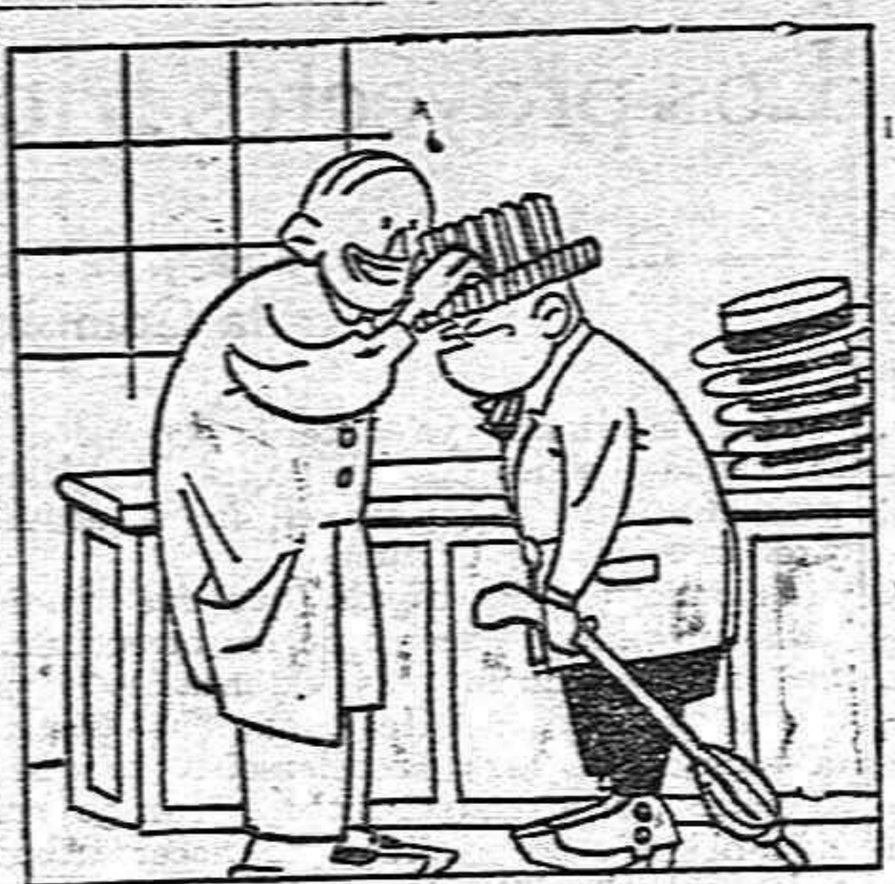
—¿Cualquiera de aquellos sombreros le está bien, don Paco. Es sólo cuestión del color.