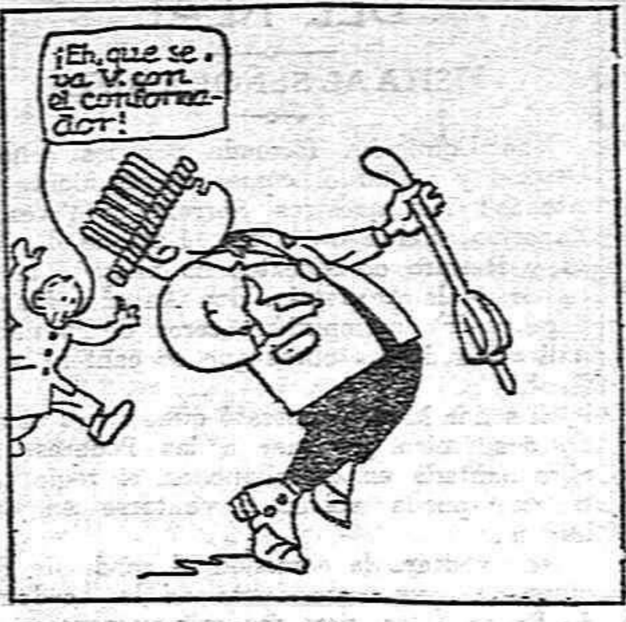
—¿Qué barbaridad lo que pasa este combrero! Si no me deja andar! Nada, que estoy como borracho. ¡Ni que el sombrero se me hubiera subido a la cabeza!