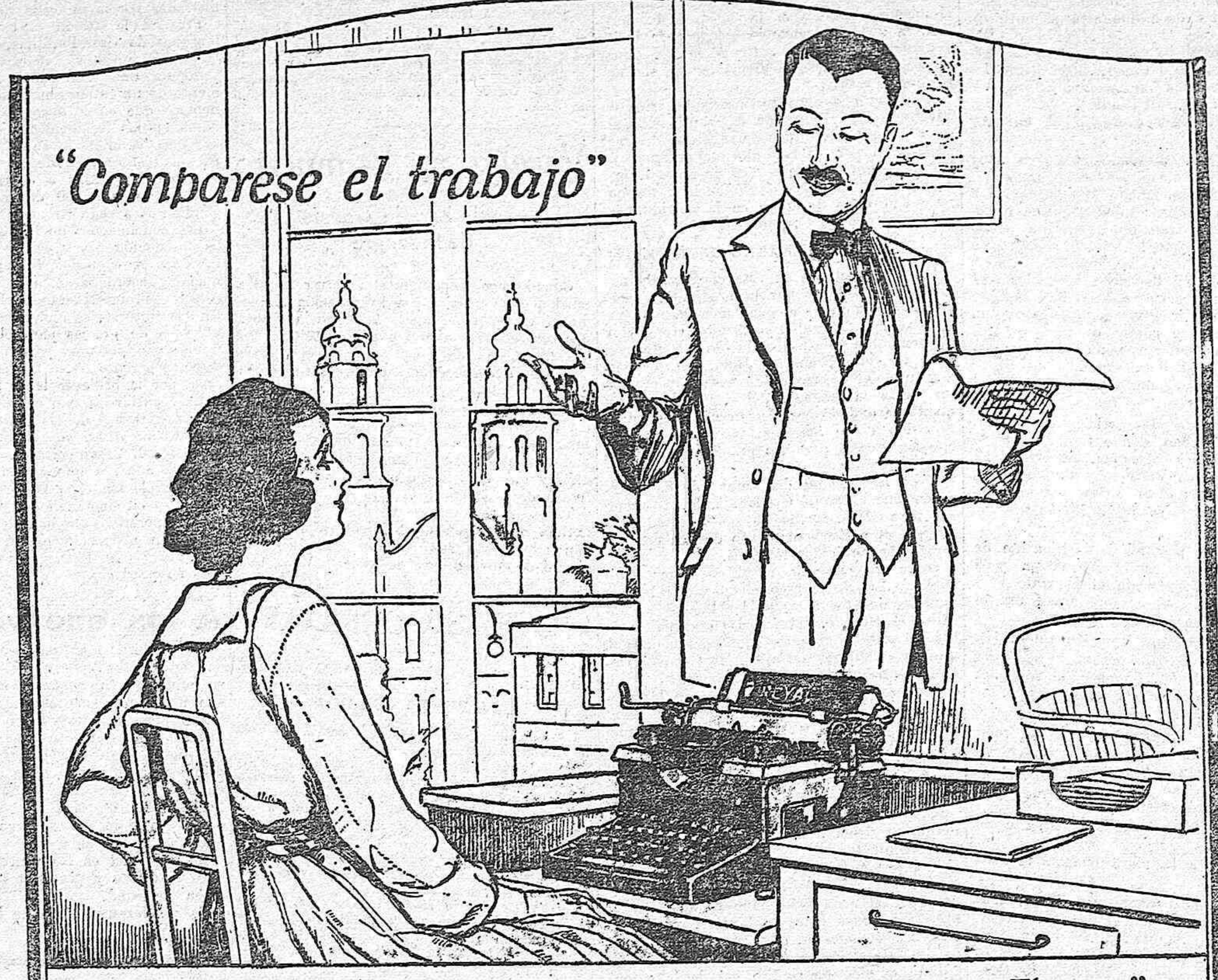
"Comparese el trabajo"