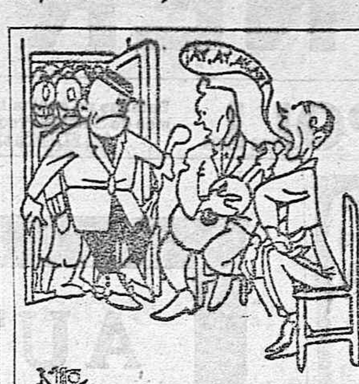
—Pero, ¿qué es esto? —Es lo ven, señores. El «Jipico» que se está arrancando por colares.