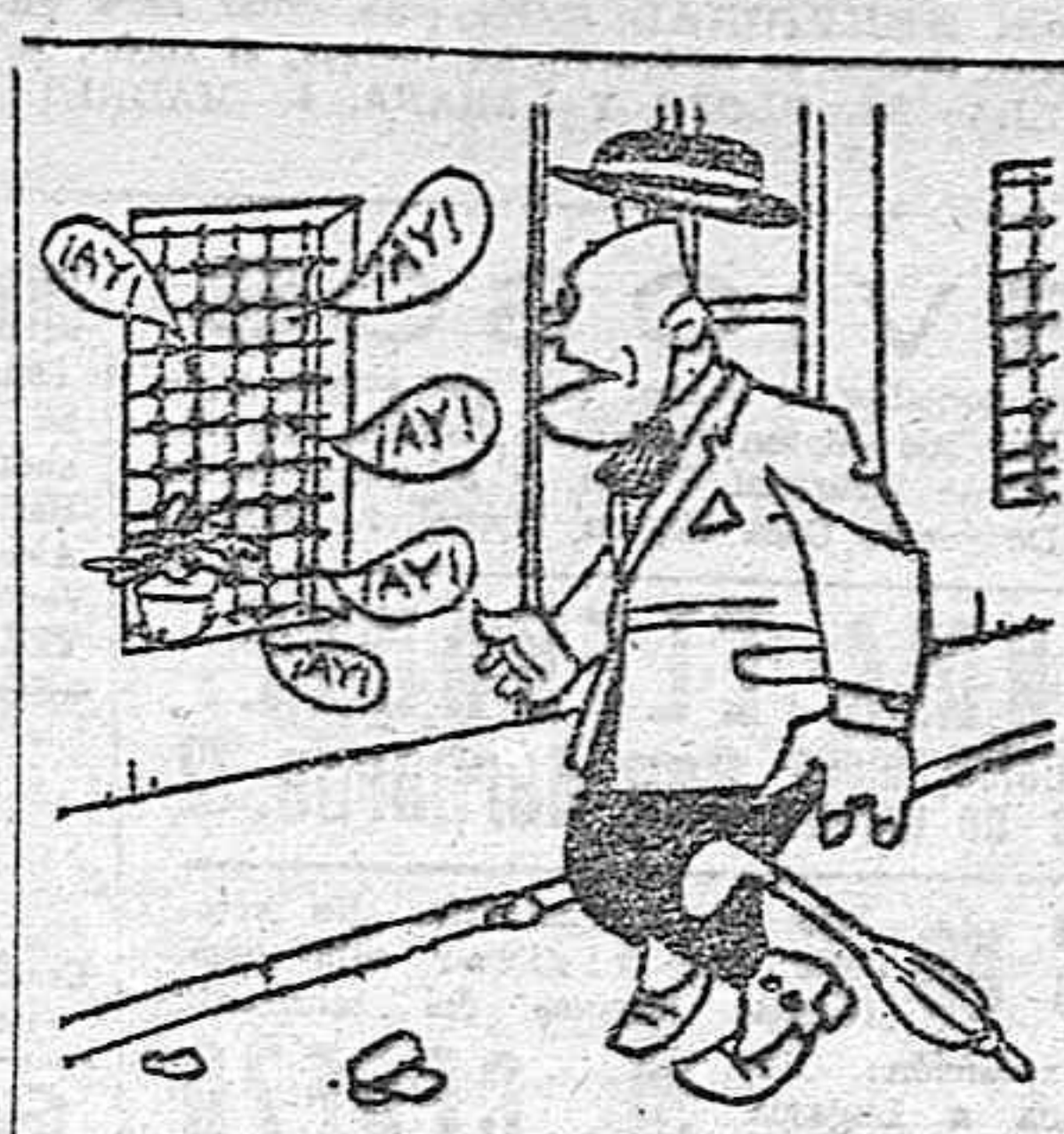
¿Qué pasará aquí? ¿Qué ayas son éstas? ¿Algún crimen? ¿Algún alma en pena?