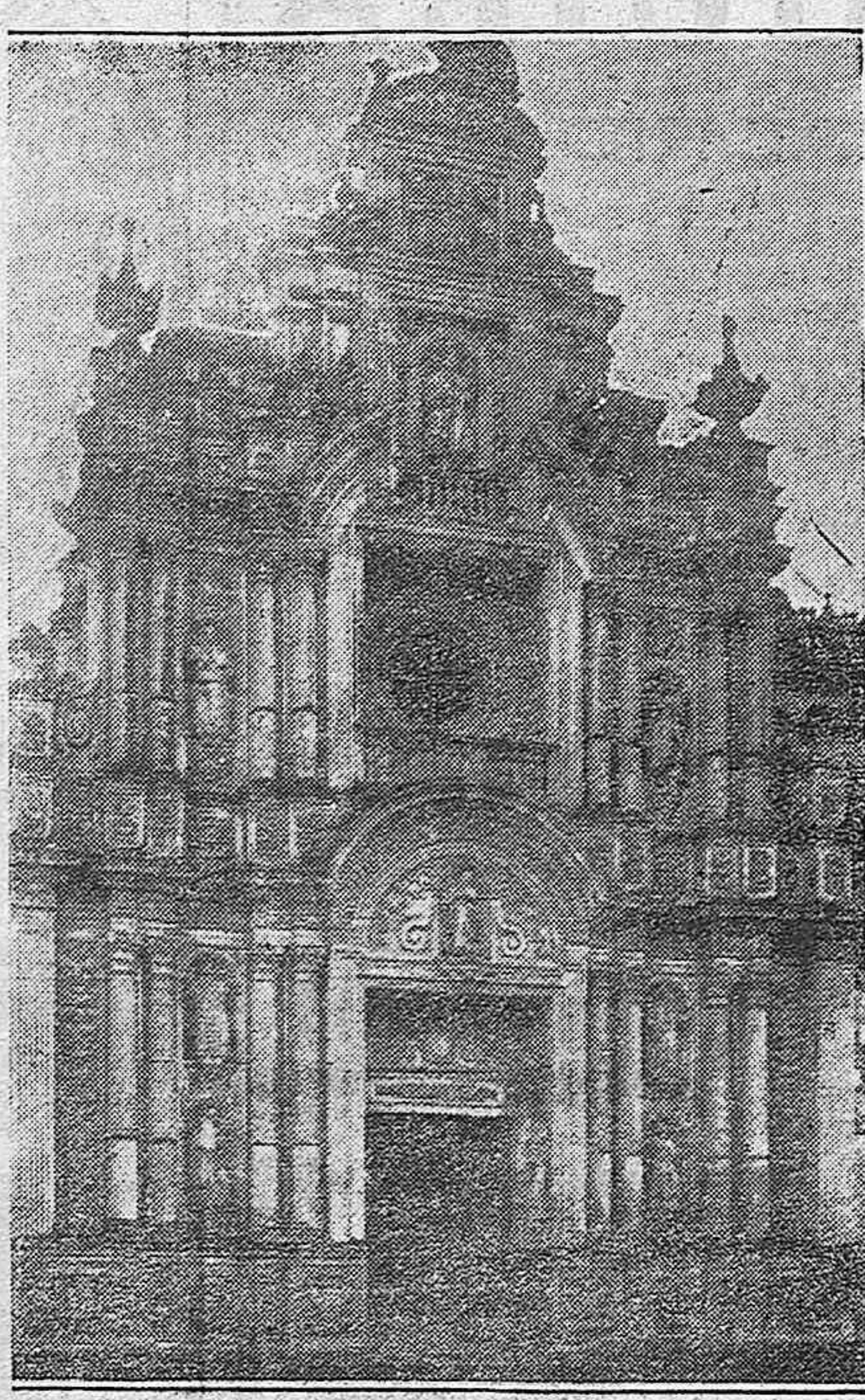
JEREZ DE LA FRONTERA—La Cartuja

CORAC «EXPLORADOR» MANZANILLA «LA PASIEGA»