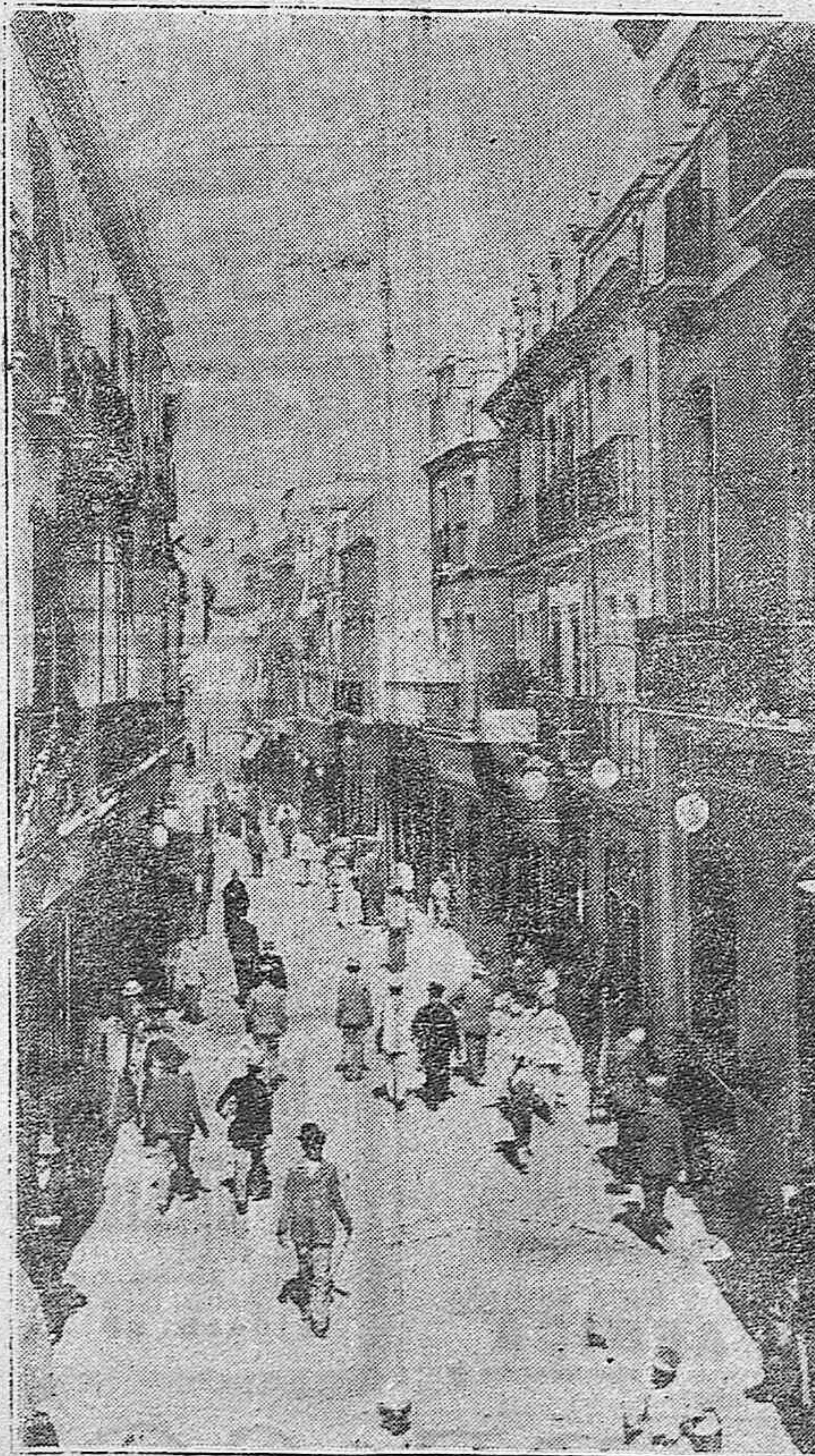
SEVILLA.—Calle de la Sierra