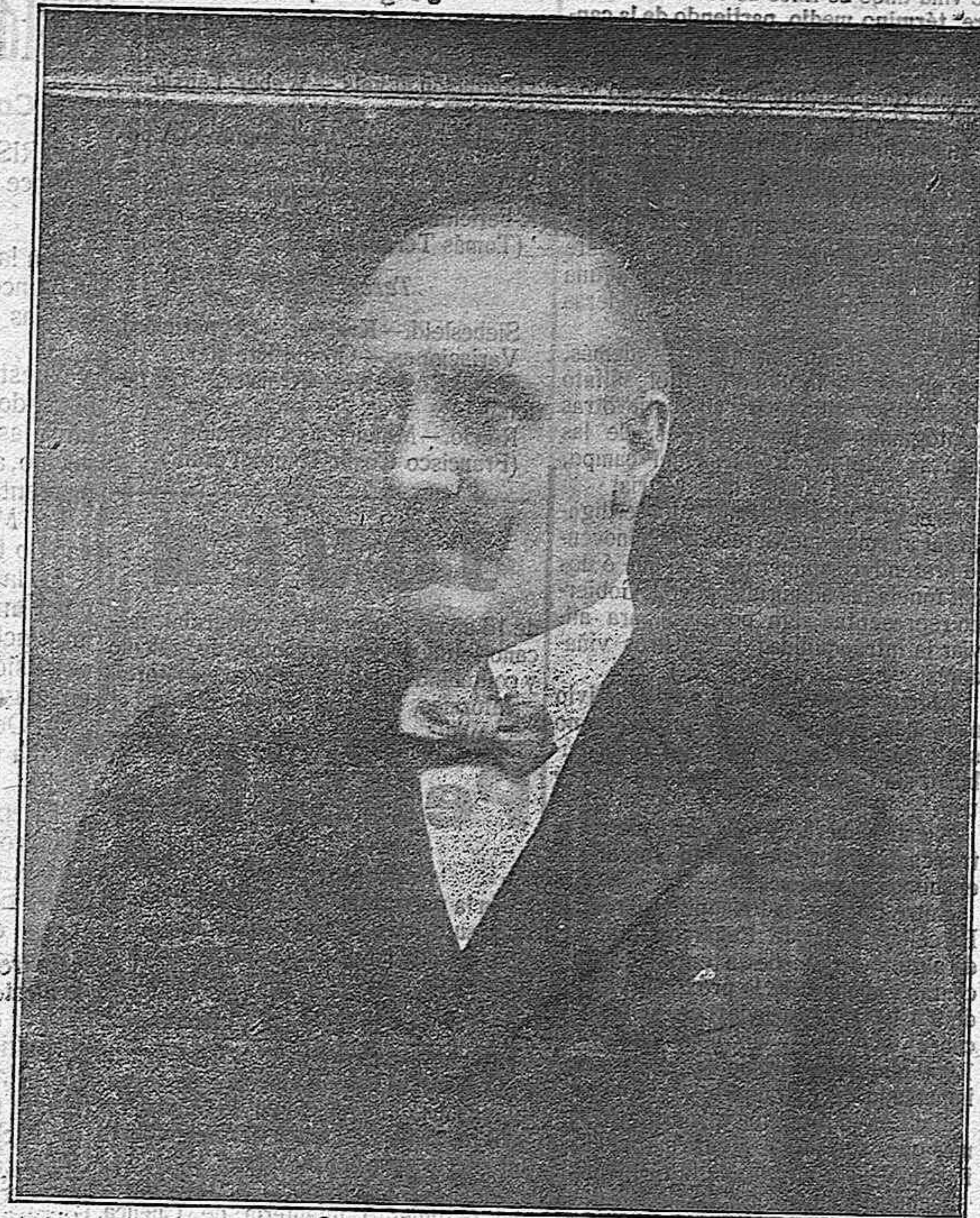
D. Casimiro Pando-Argüelles, Diputado por Laguardia