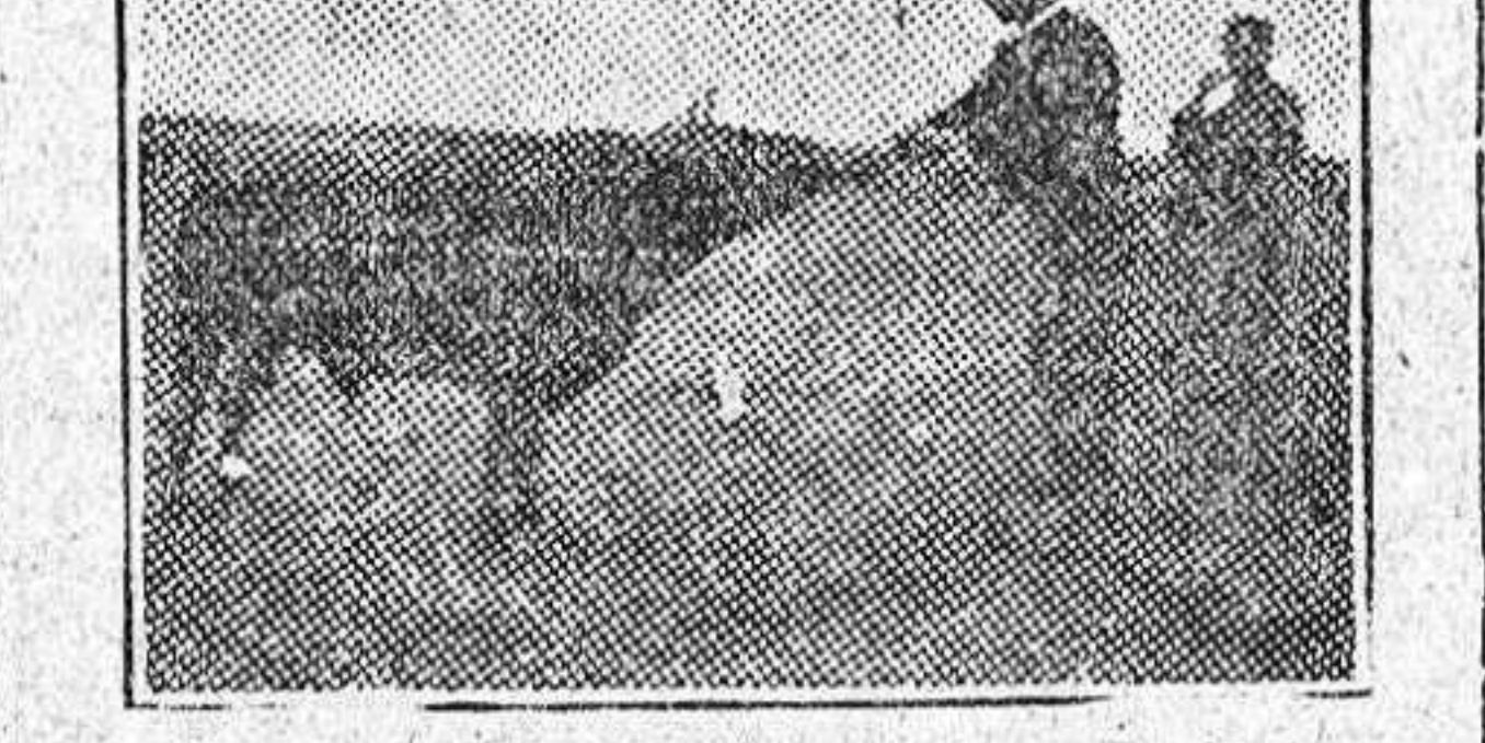
«Granaculo», toro de la ganadería de la Viuda de Soler.