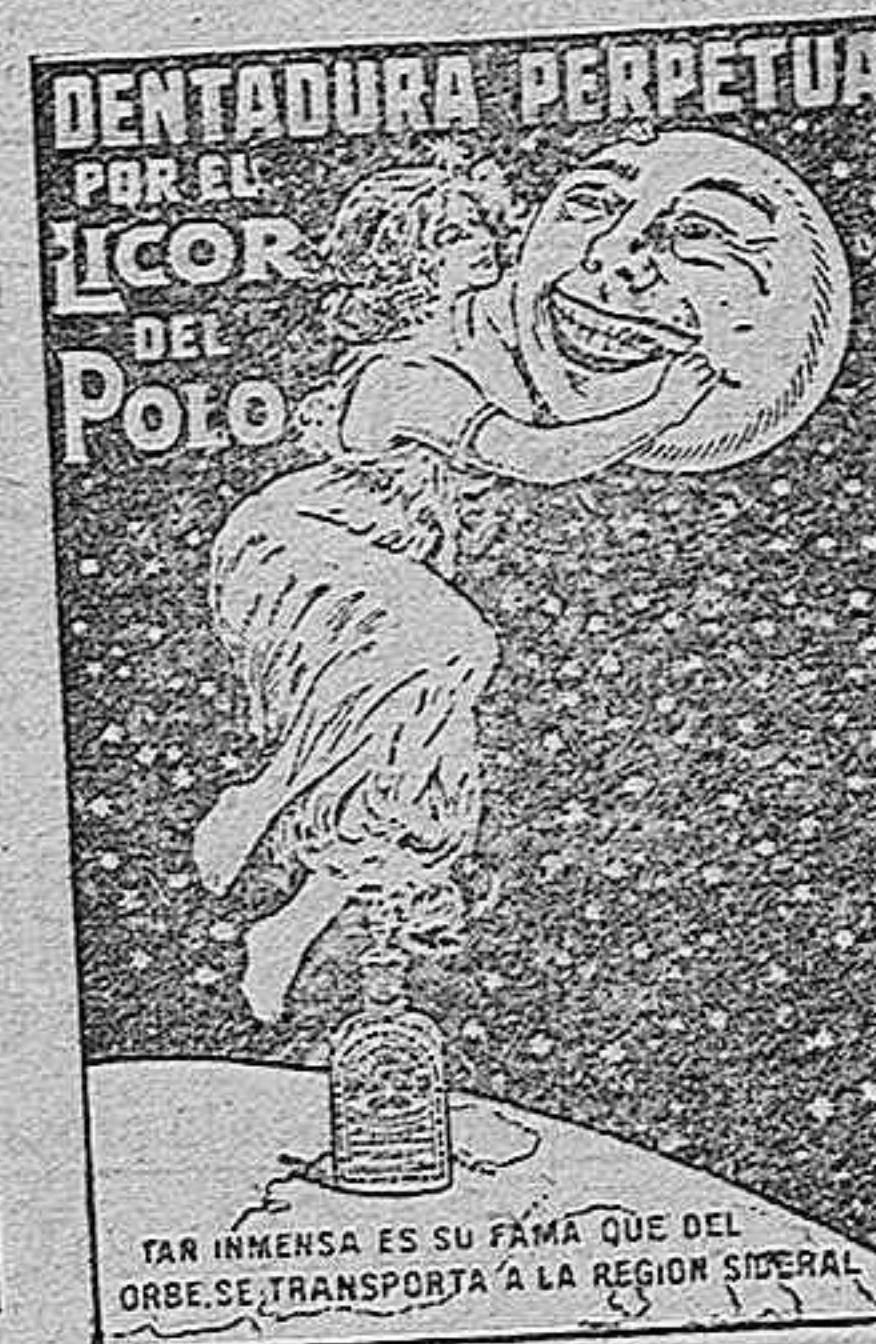
TAN INMENSAS ES SU FAMA QUE DEL OREBE SE TRANSPORTA A LA REGIÓN SIBERIAL

TELÉFONO N.º 25.—VITORIA Fus ros, 1 (frente al palacio de la Reina de Alava)