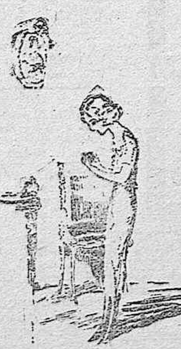
...era un magnífico reloj de brillantes, reloj que pertenecía a mi abuela...