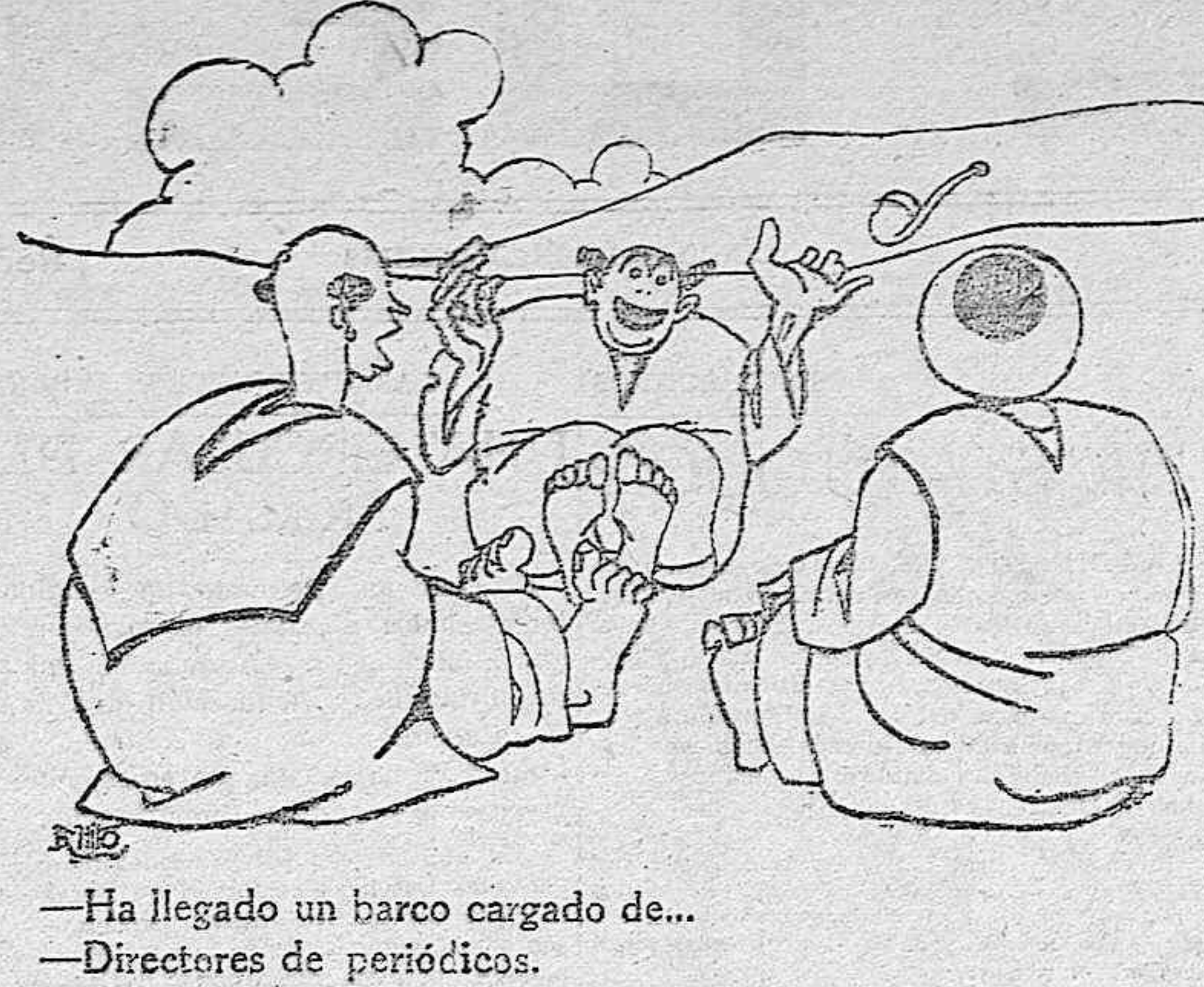
—Ha llegado un barco cargado de... —Directores de periódicos.

las Navas y las ametralladoras de Regular han venido a la plaza. Se dice que el objetivo de las operaciones que se efectuarán cuando el general Berenguer regrese de Melilla, será establecer contacto con la zona francesa, por medio de un movimiento combinado desde Xauen a Aternun, por detrás de Yebel Alam, entre este punto y Baharem, cortando por Aternun.