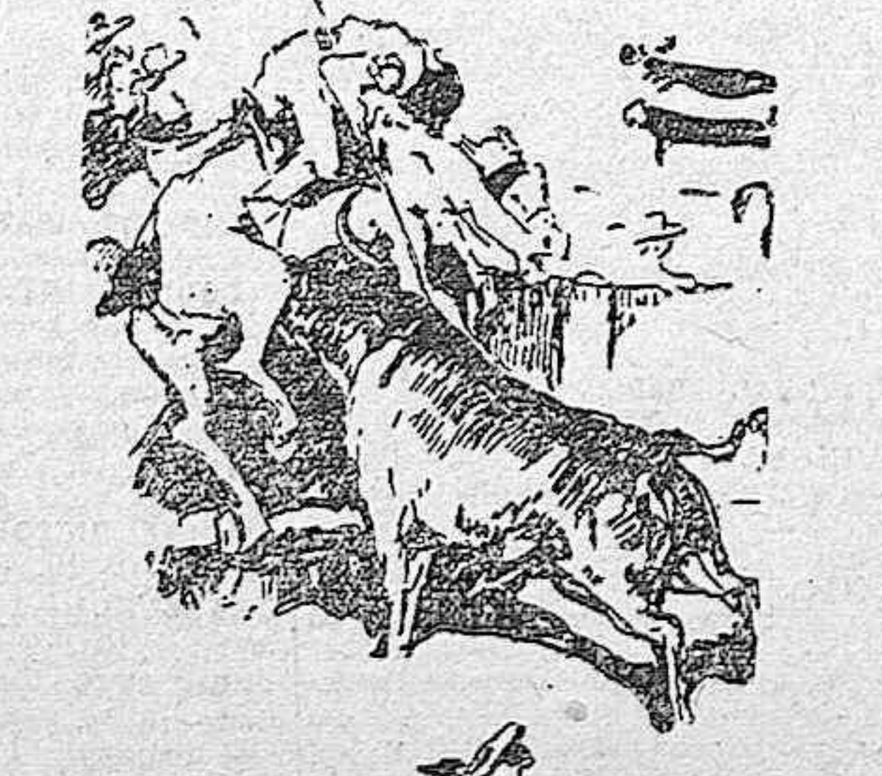
Impetuosamente saltó a la arena el toro...