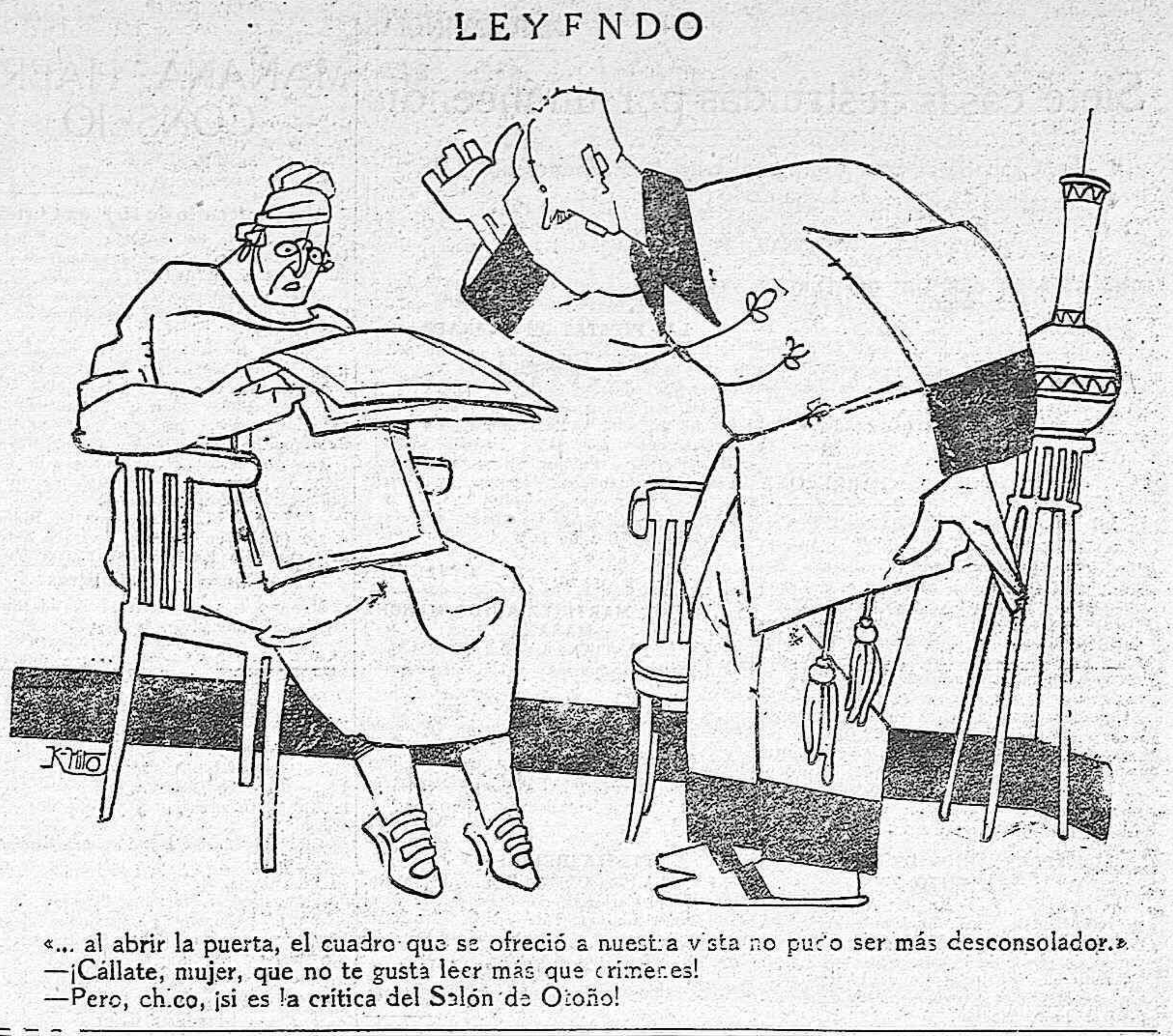
«... al abrir la puerta, el cuadro que se ofreció a nuestra vista no pudo ser más desconsolador.» — ¡Cállate, mujer, que no te gusta leer más que crímenes! — Pero, chico, ¡si es la crítica del Salón de Otoño!

Have ya tanto tiempo, que no me acuerdo donde lei yo que Alejandro Ma... ¿No los conocen ustedes? Ya lo creo que los conocerán.