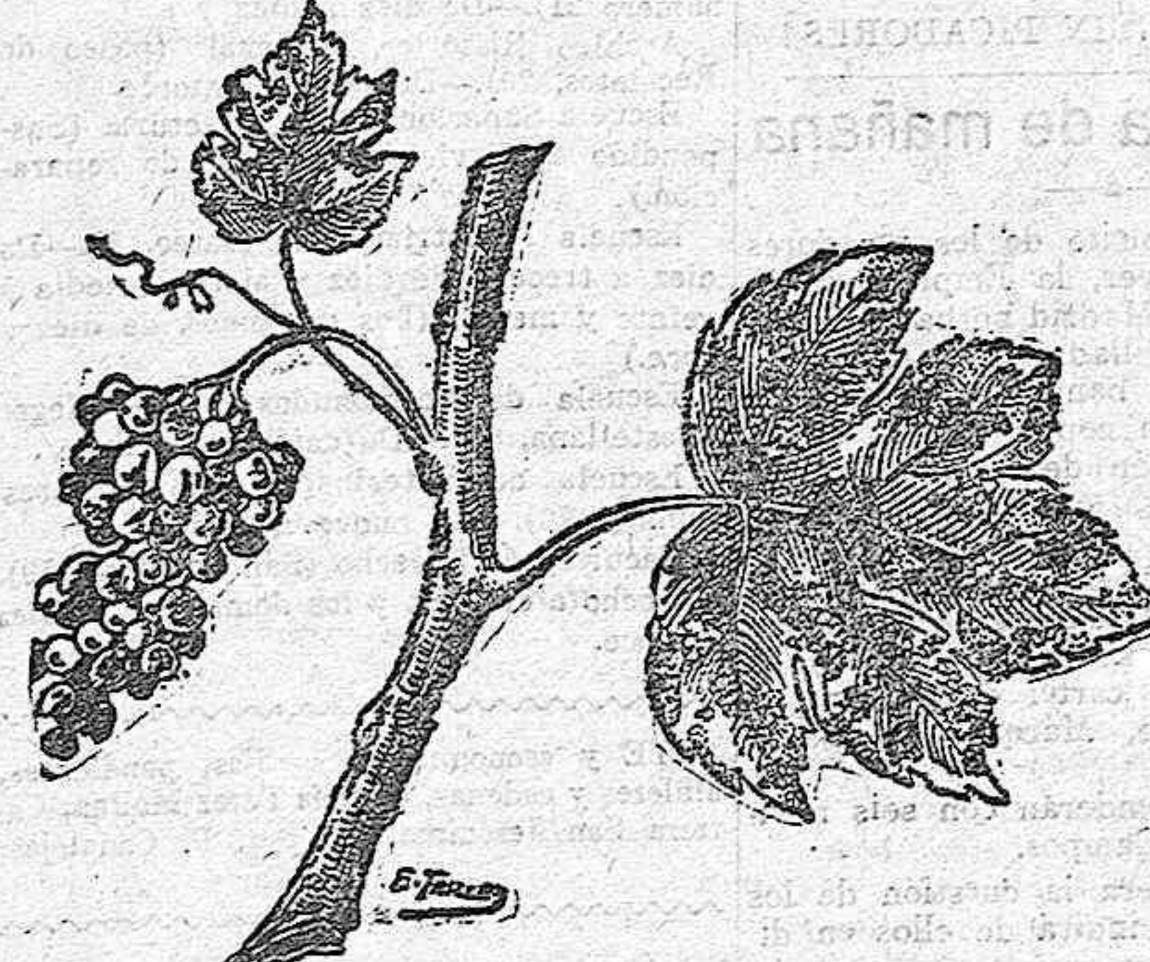
DAÑOS DEL OIDIUM A LA VID