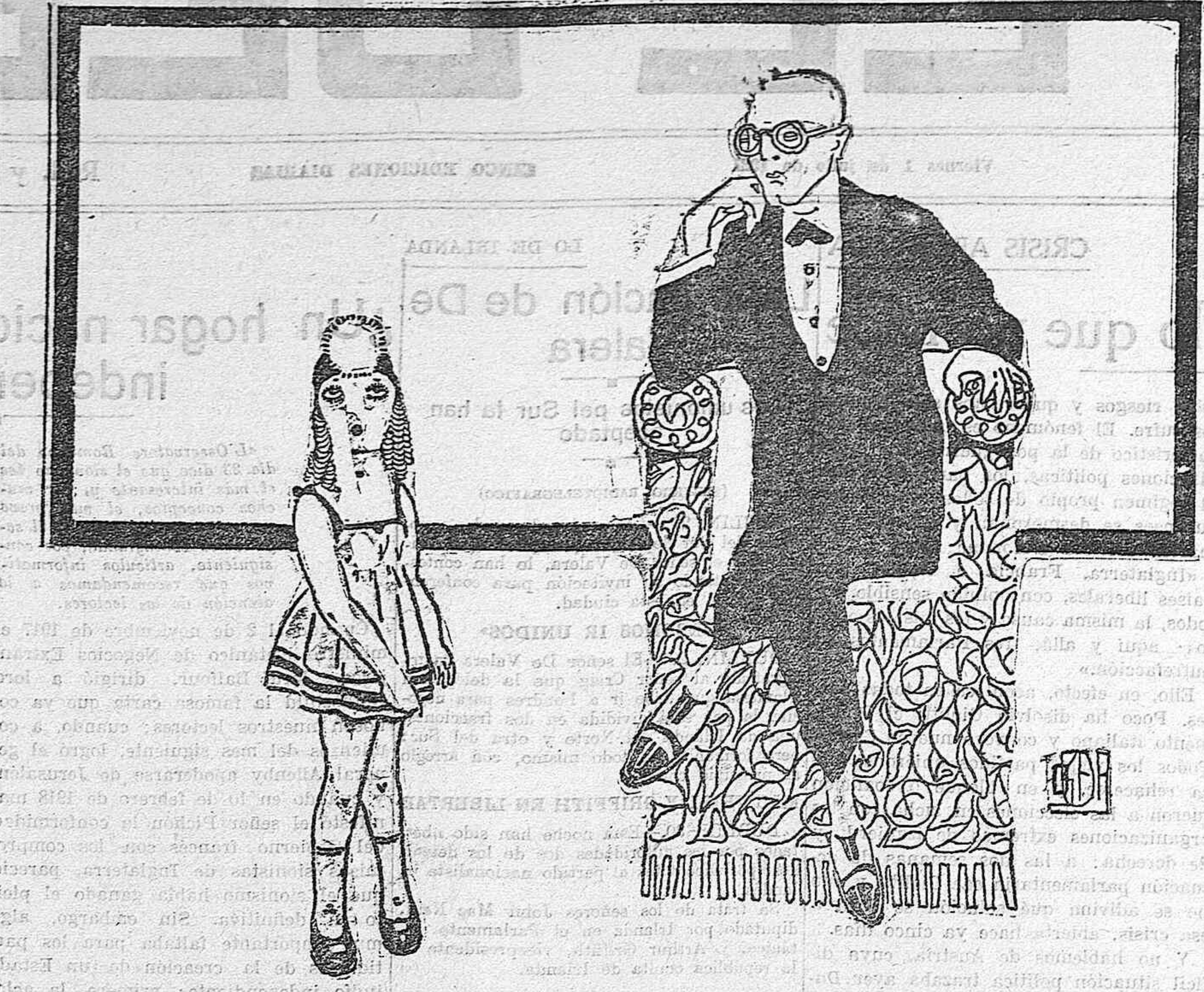
—Pero, cómo vas tan corta, hija mía? —Porque ha dicho mamá que así se notará un poquito cuando me pongan de largo.