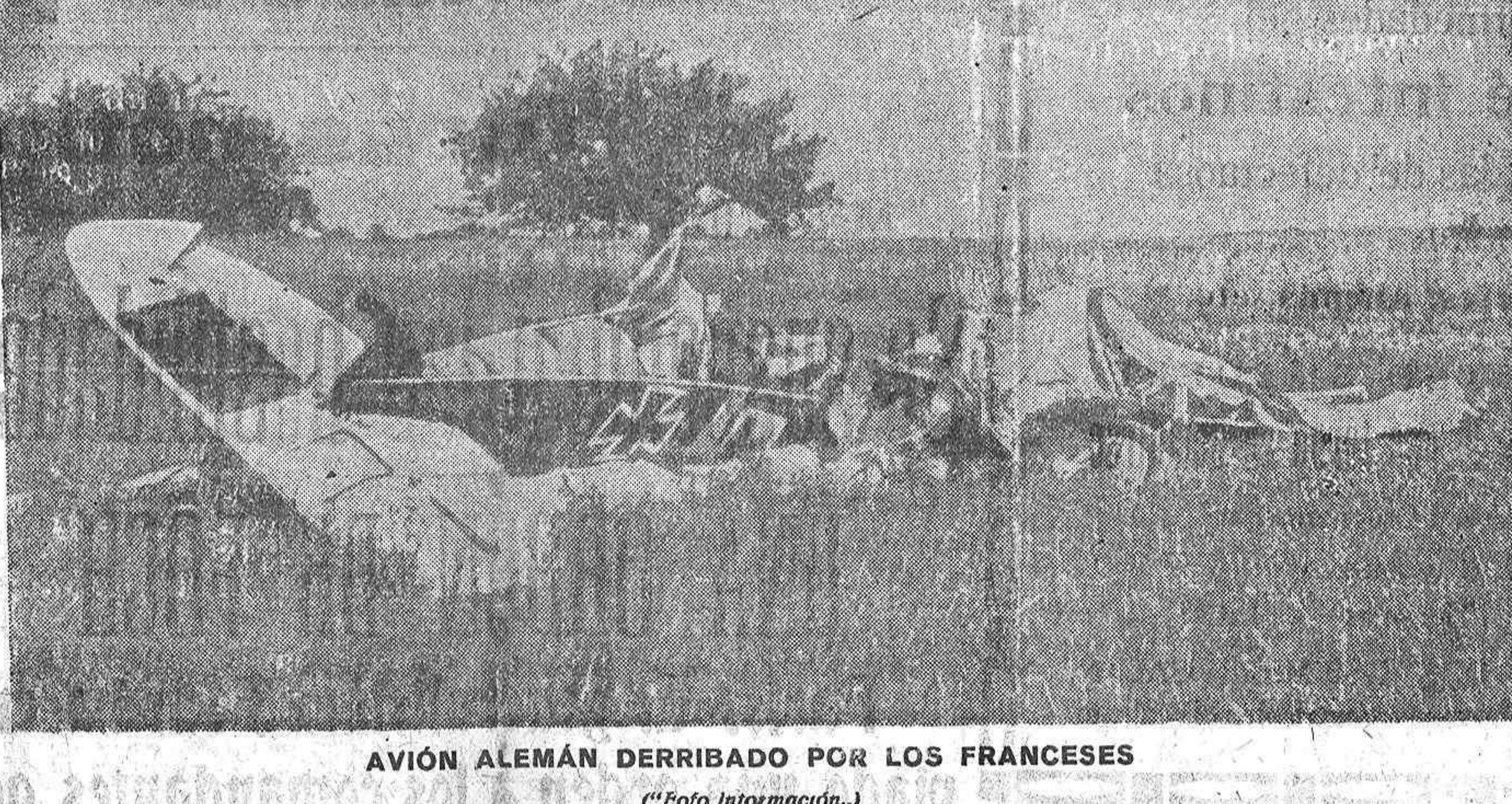
AVIÓN ALEMÁN DERRIBADO POR LOS FRANCESES

¿Conoce usted el SANOLÁN? Vea la tercera plana.