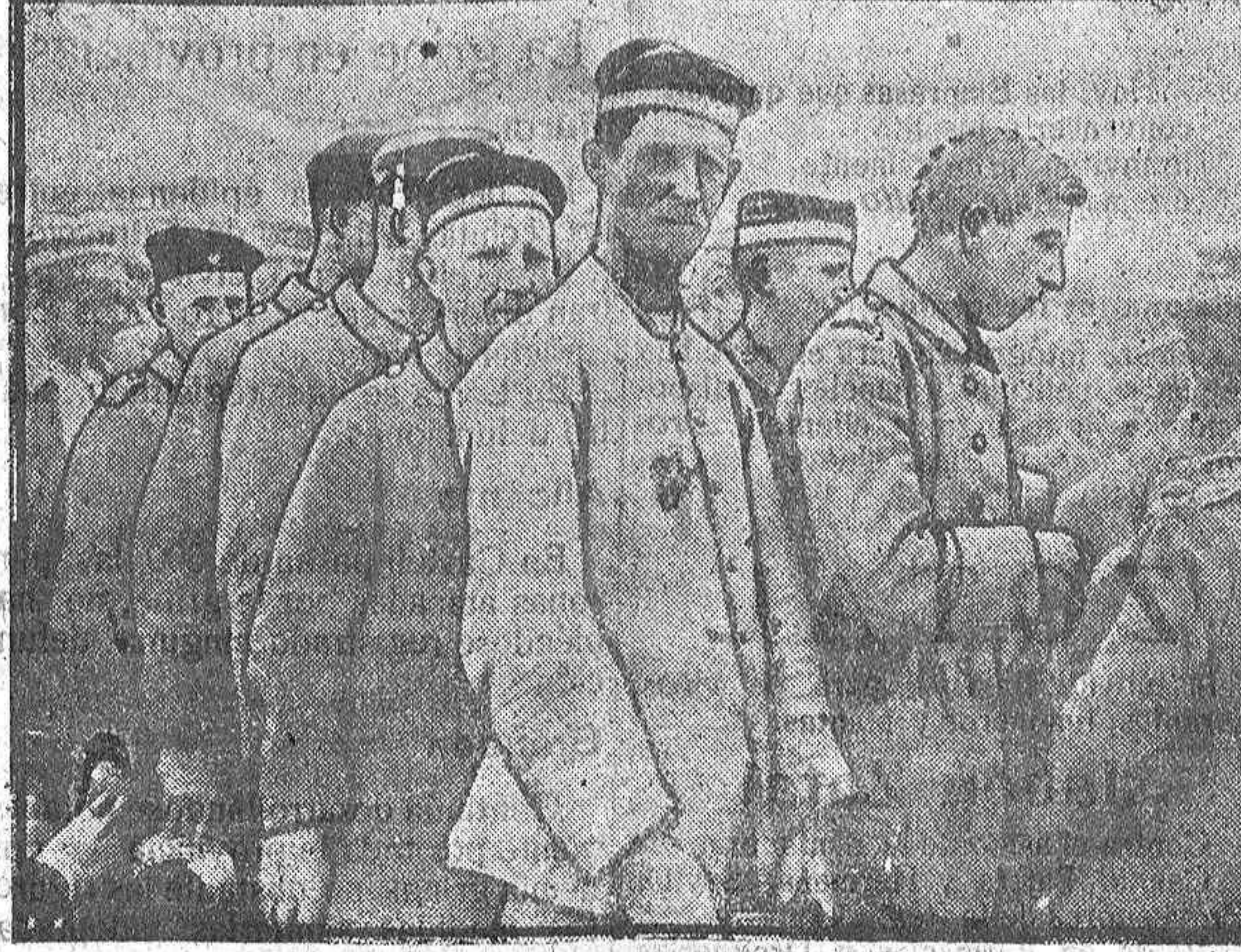
PRISIONEROS ALEMANES COGIDOS EN LOS ULTIMOS COMBATES