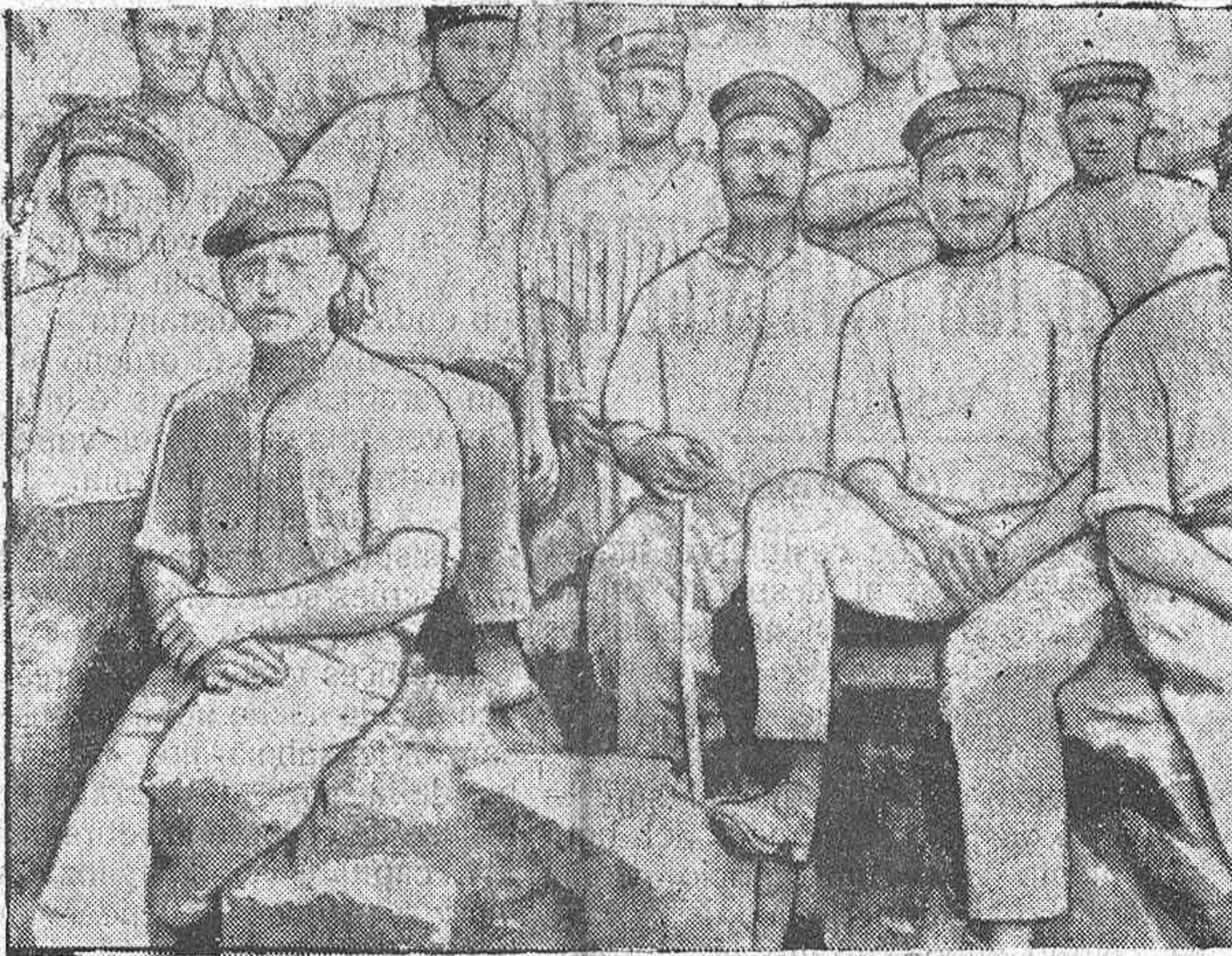
PRISIONEROS ALEMANES

patías del pueblo más verdaderamente religioso del mundo, los Estados Unidos, por conceputar que dichos procedimientos están en pugna con todos los derechos divinos y humanos.