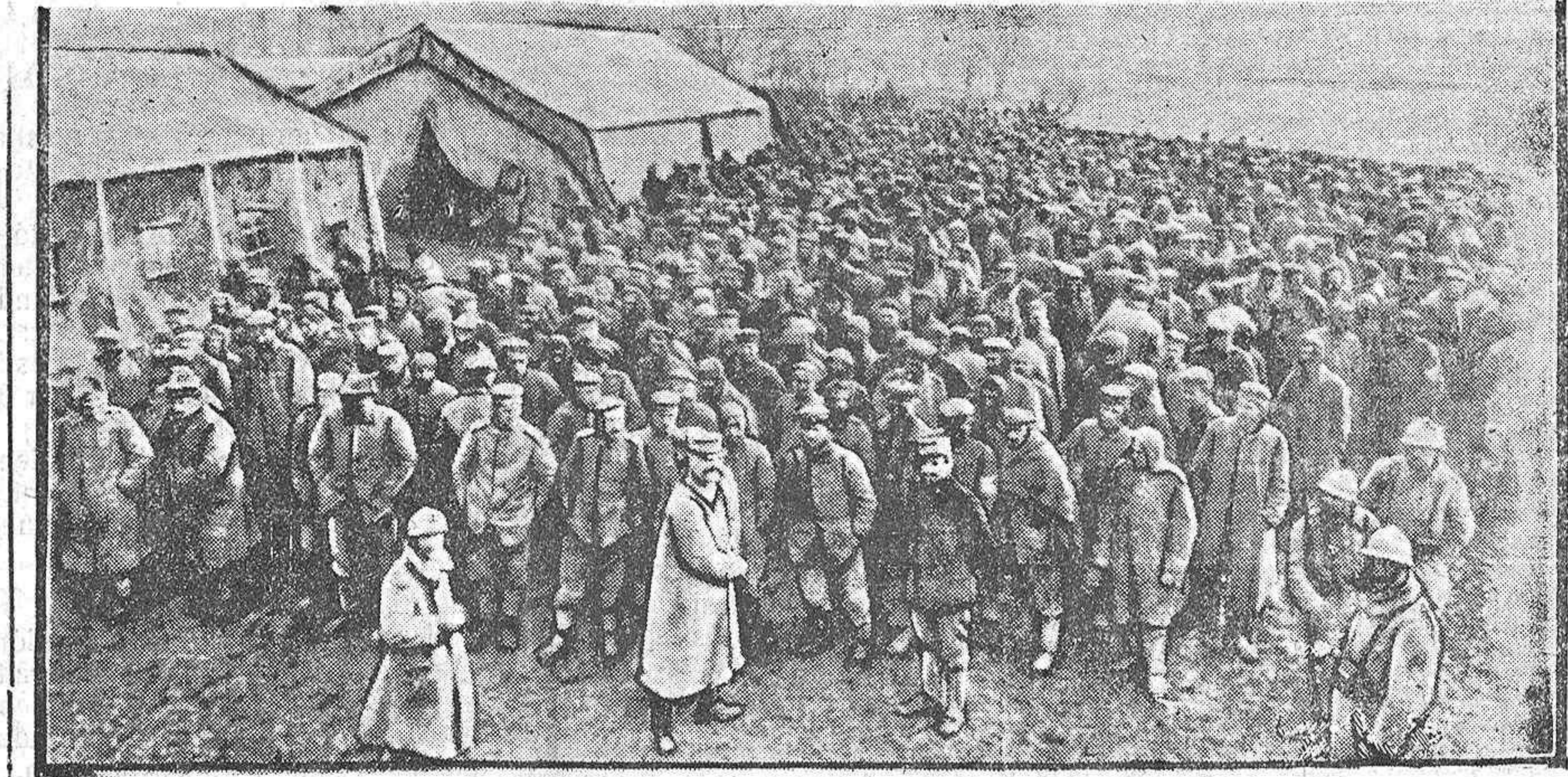
Prisioneros hechos en Verdun por los franceses