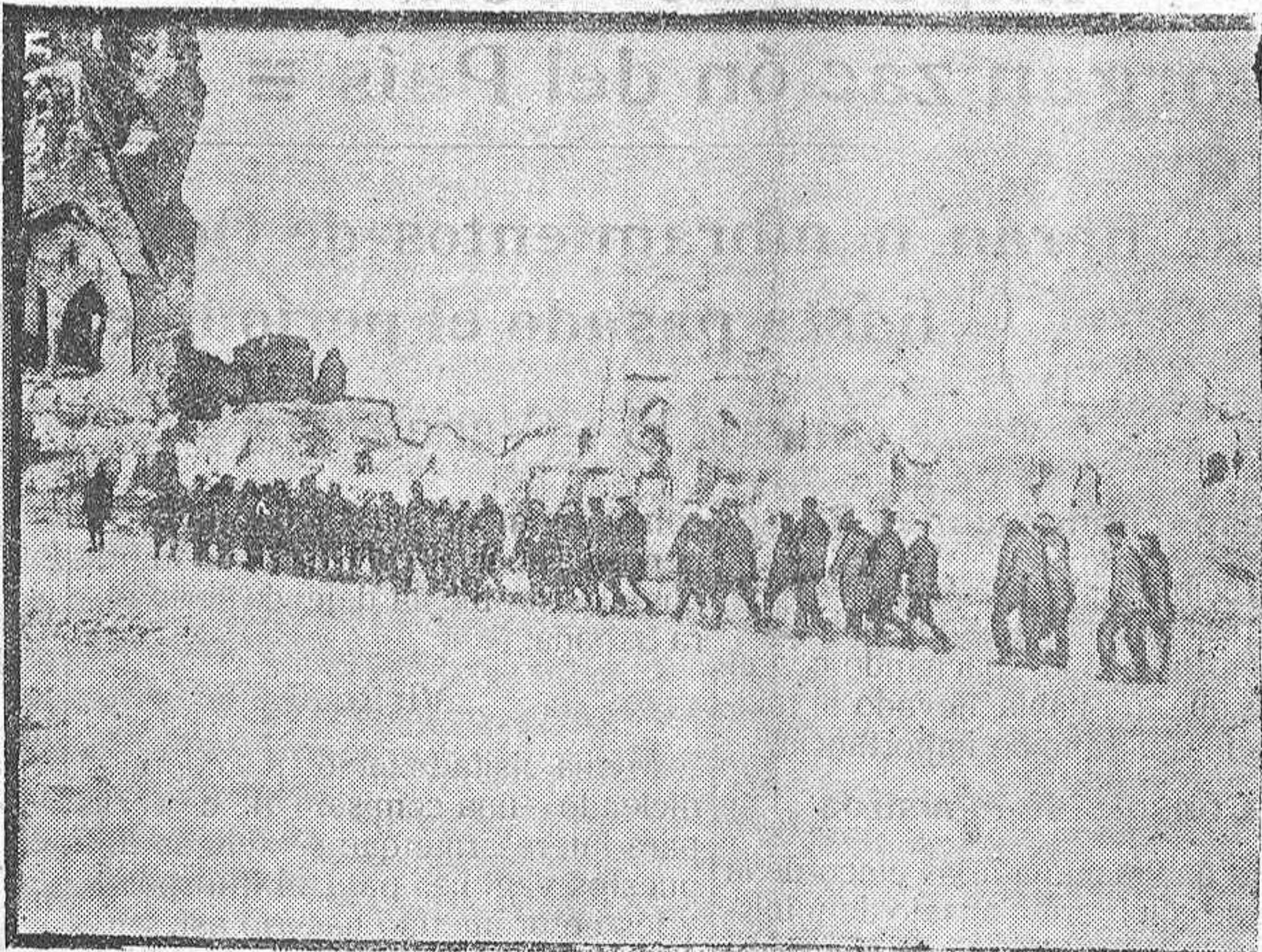
CONVOY DE PRISIONEROS ALEMANES ATRAVESANDO IPRES

por entre la tapia del jardín de la antigua casa del marqués de Legarda, hoy de doña Dolores Torres, y la casa número 2 de la calle de los Fueros, que hace esquina a la de San Prudencio.