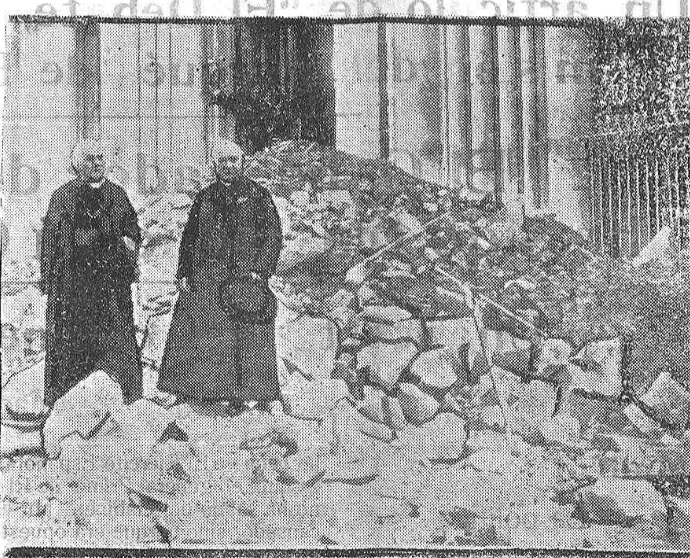
El Cardenal Luçon en las ruinas de la catedral de Reims