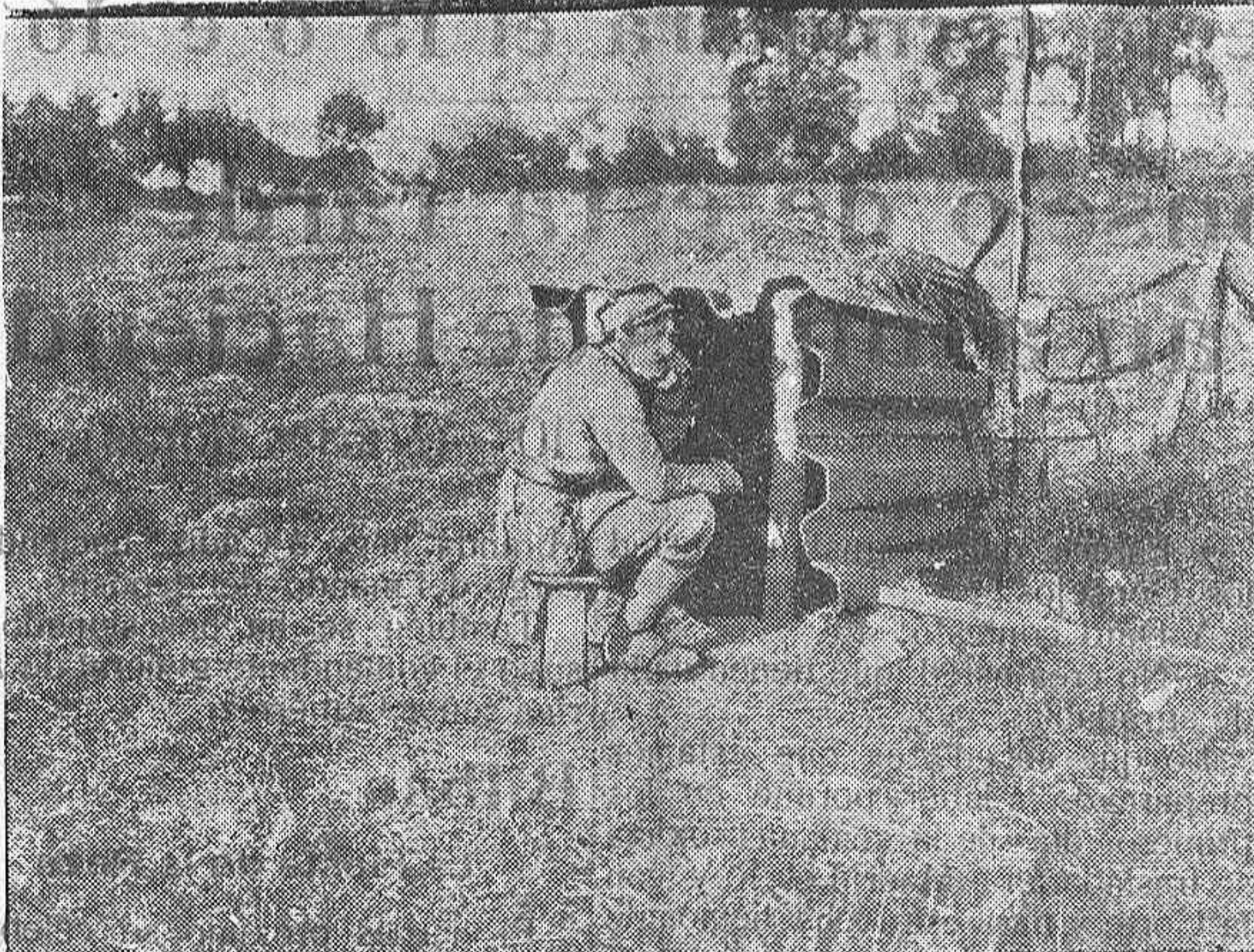
TELEFONISTA DE UNA BATERIA

Formando grotescos dibujos, asciende el humo de los cigarrillos al espacio. Un conjunto humano, polígrafo e informe, se entrega, con entusiasmo, á sus distracciones favoritas. Juegan los unos discutiendo con calor, una por una, todas las jugadas; se habla de la guerra en otro lugar; de política, en otro; y en un rincón, mostrándose el espolismo en todo su apogeo, se discuten las faenas de Belmonte y las canciones de la Goya. De pronto, en aquel templo de la holganza y el buen humor, se oyen los primeros acordes de una canción popular. Una figura gentil trepa ligera las escalerillas del tablado. Creo que voy á oír á una de tantas «artistas» que en los «cafés» dejan oír sus «gorjeos». Pero una voz admirablemente timbrada, una forma de decir el cuplé que nada tiene de vulgar, me hace seguir con atención creciente los movimientos de una mujer joven y bella, que sabe poner en su voz los sentimientos de su alma. Y oyendo con deleite á «La Amaya», pienso... El arte es madre de todo lo bello. Por eso «La Amaya» es hija del arte, porque ella es bella y su belleza hija de un artista sin par: de la Naturaleza. Y es también hija del arte porque á él consagra su juventud y sus amores. Querido lector: Pocas veces, como esto, tendrás ocasión de oír á una canzonetista que, siendo verdaderamente artista, actúe en un café. Actúe una noche al Café Suiizo y ten