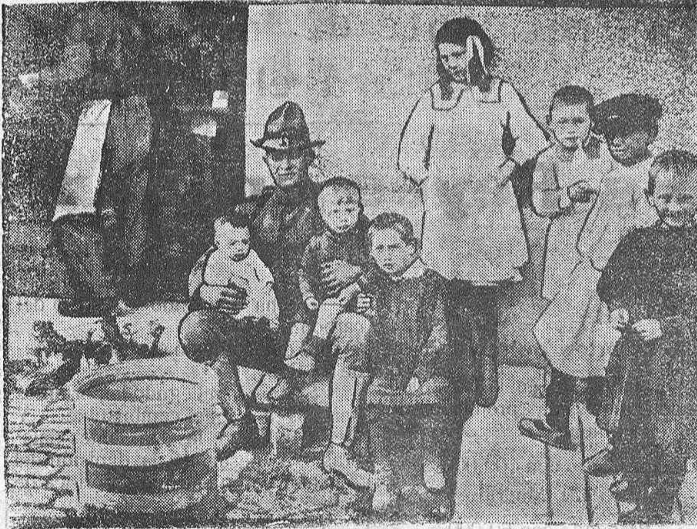
FRATERNIDAD FRANCO-AMERICANA