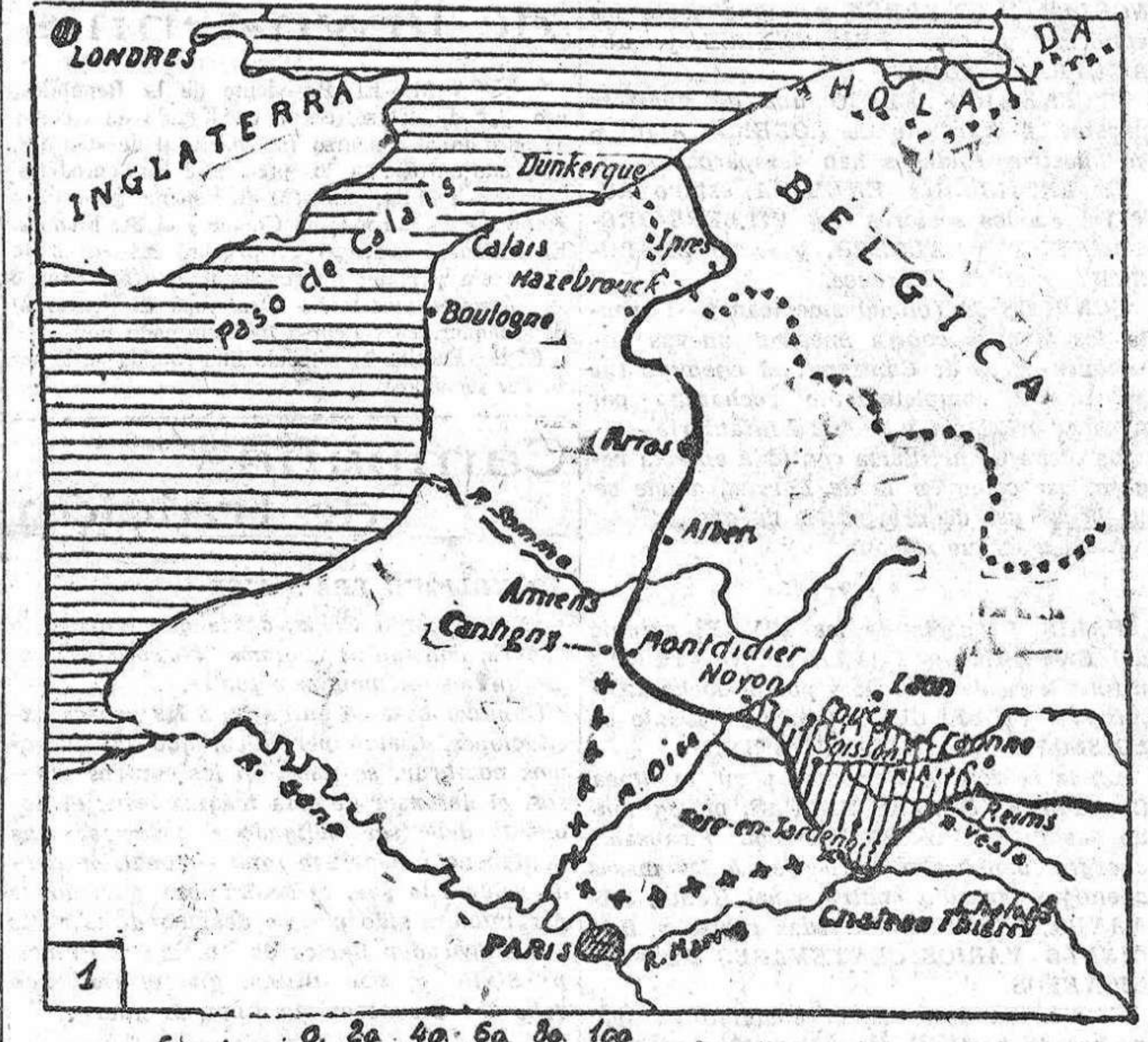
Etscala 0. 2a. 4a. 6a. 8a. 10a. Kilómetros --- Posición de los alemanes en la madrugada del 27 --- Id id id id id en la noche del 29 ++++ Id que acaso pretendían ocupar como consecuencia de su ofensiva.

de gloria y audaces, rebasaron Paris hacia el Sur, tuvieron que retroceder a buscar posiciones fácilmente defendibles para aguardar tiempos mejores, para esperar el momento de aplastar a sus enemigos en Oriente y poder revolverse contra los de Occidente... Cerca de cuatro años han sido menester para llevar a feliz término aquella gigantesca obra (que no he de recordar, porque en la memoria de todos está), al cabo de los cuales, los que en 1918 conservaban castidad las posiciones que en 1914 tenían (a pesar de las numerosas victorias que los aliados se han apuntado en su haber), creyeron llegado el momento de pasar de la