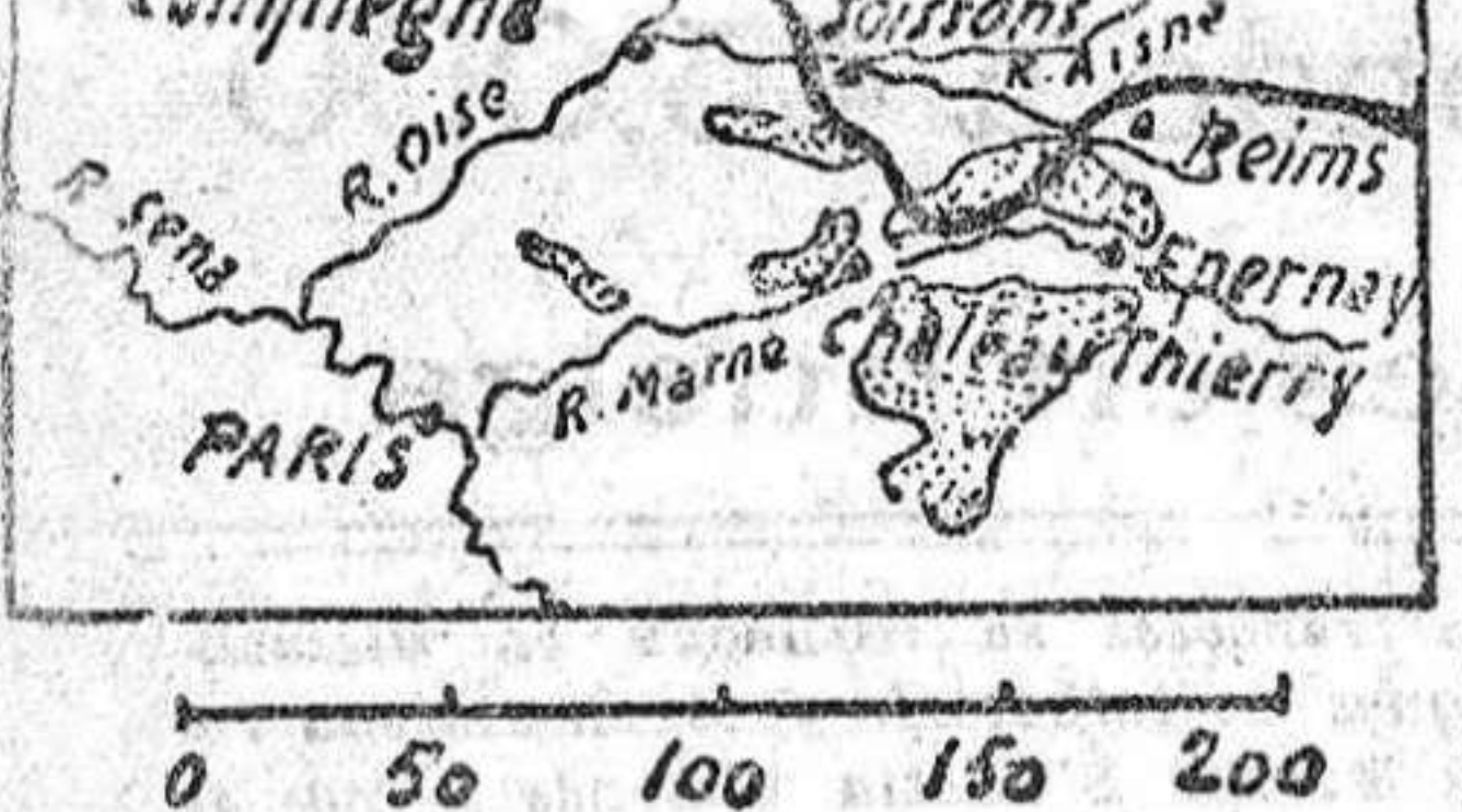
Posición actual de la línea de batalla.

Paris continúa siendo bombardeado. No importa... Los aliados tienen todavía la con-