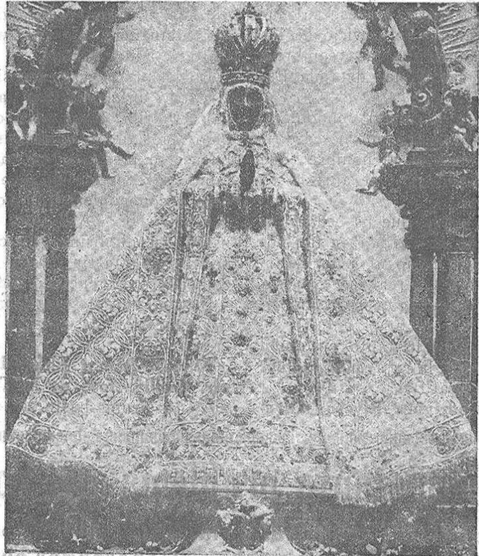
El manto de las ochenta mil perlas

Compónese de doscientas cincuenta y ocho onzas de aljofar, algunos granos como garbanzos gordos y todo de un fino oriente que podría pasar mucho por perlas; trescientas onzas de oro fino, en hojuelas, canutillo, hilillo y fleco; cuatro grandísimas esmeraldas; ocho gruesos zafiros; treinta y dos rubíes de gran tamaño; ciento cuarenta piezas de oro vacia-