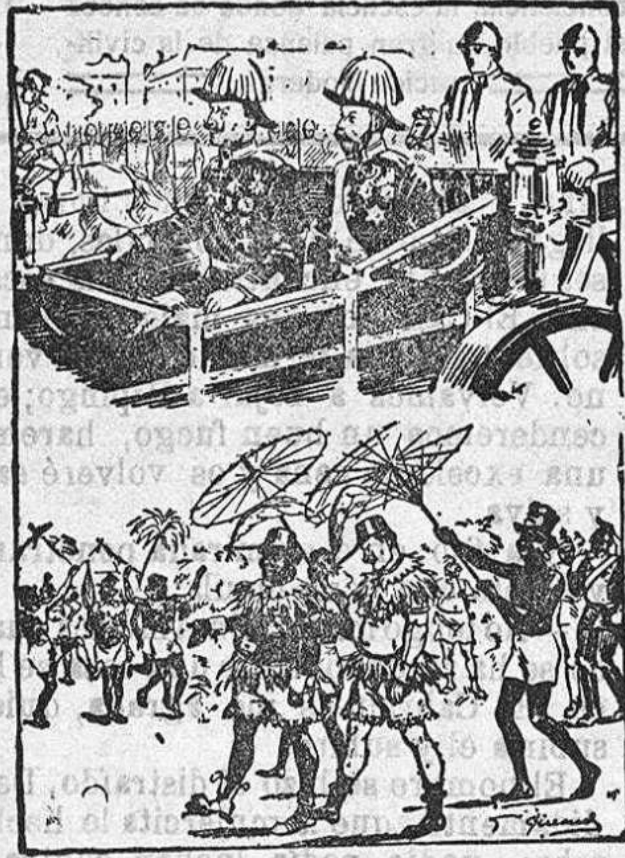
Su costumbre de vestir un uniforme del país que visita, en breve pondrá a Guillermo II en una situación poco aviosa, aunque fresca, como usted podrá ver.