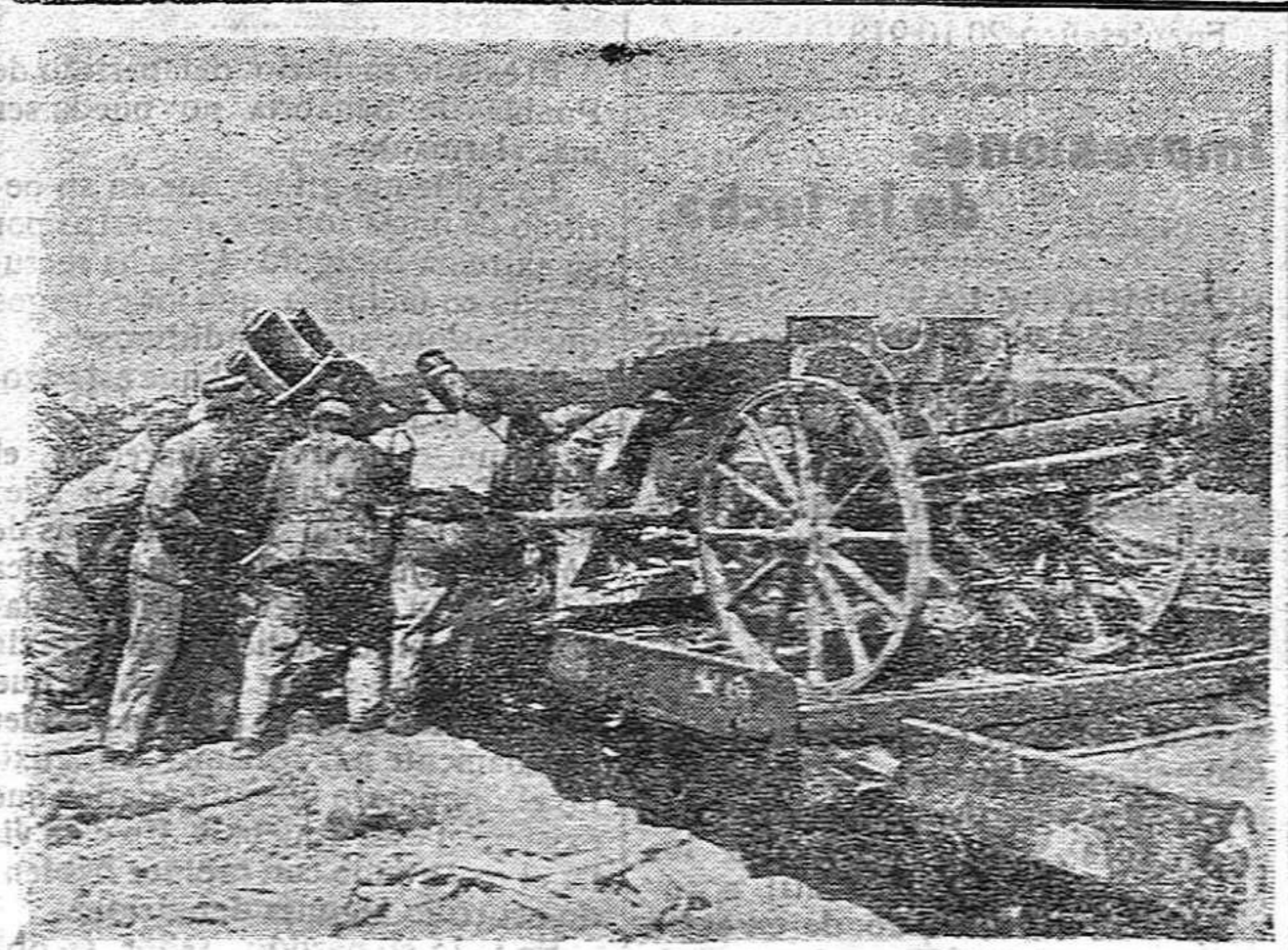
DE LA GUERRA.—Embarque de un mortero alemán de 170 capturado.

Entre los árboles malditos no puede olvidarse a la higuera silvestre en la que se ahorcó el ruin Judas Iscariote. Maldito por el Nazareno, este árbol —dice la tradición— no solo no da fruto sino que sometido a la ac-