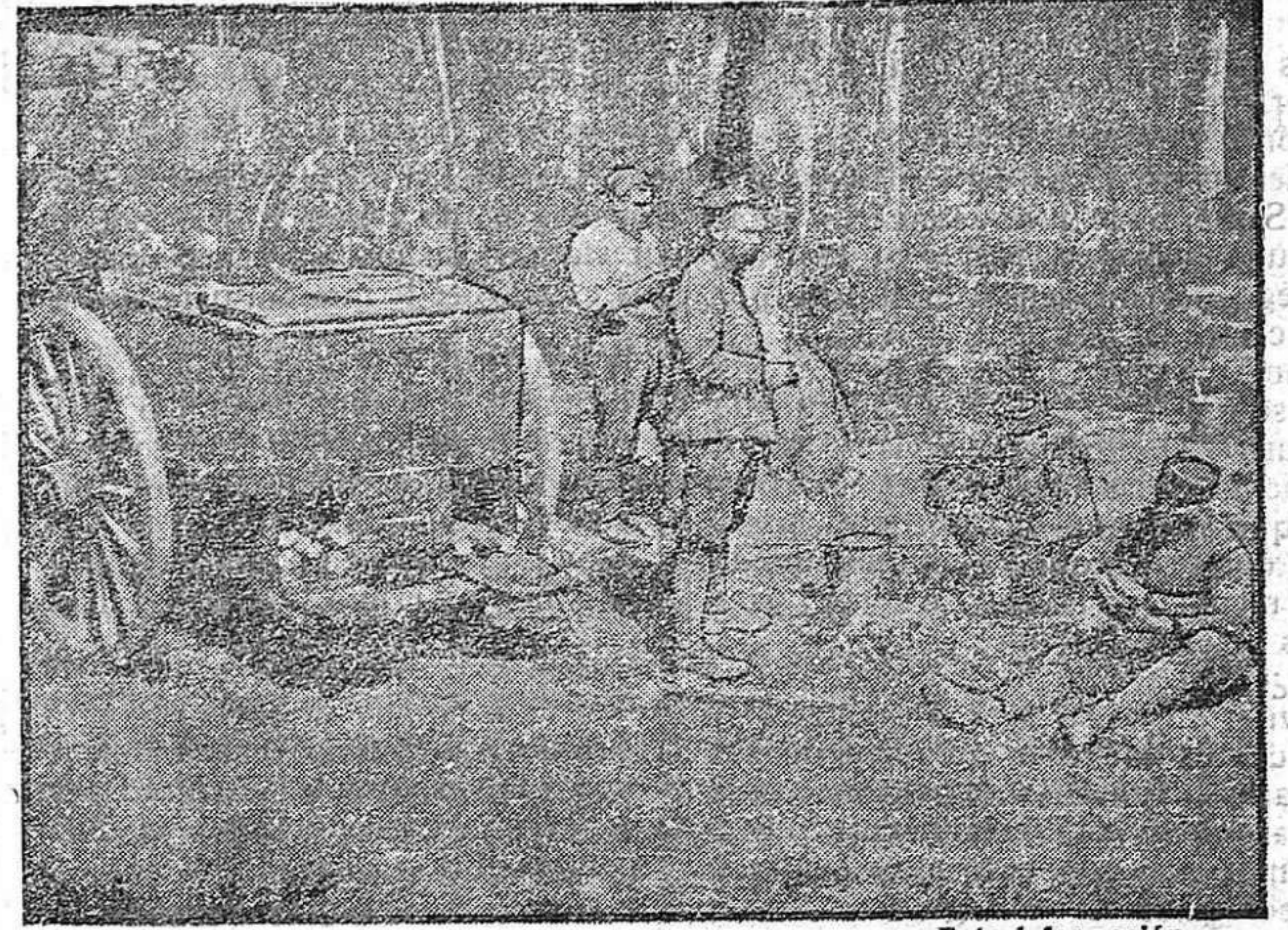
DE LA GUERRA.—Cocina ambulante de una división norteamericana.