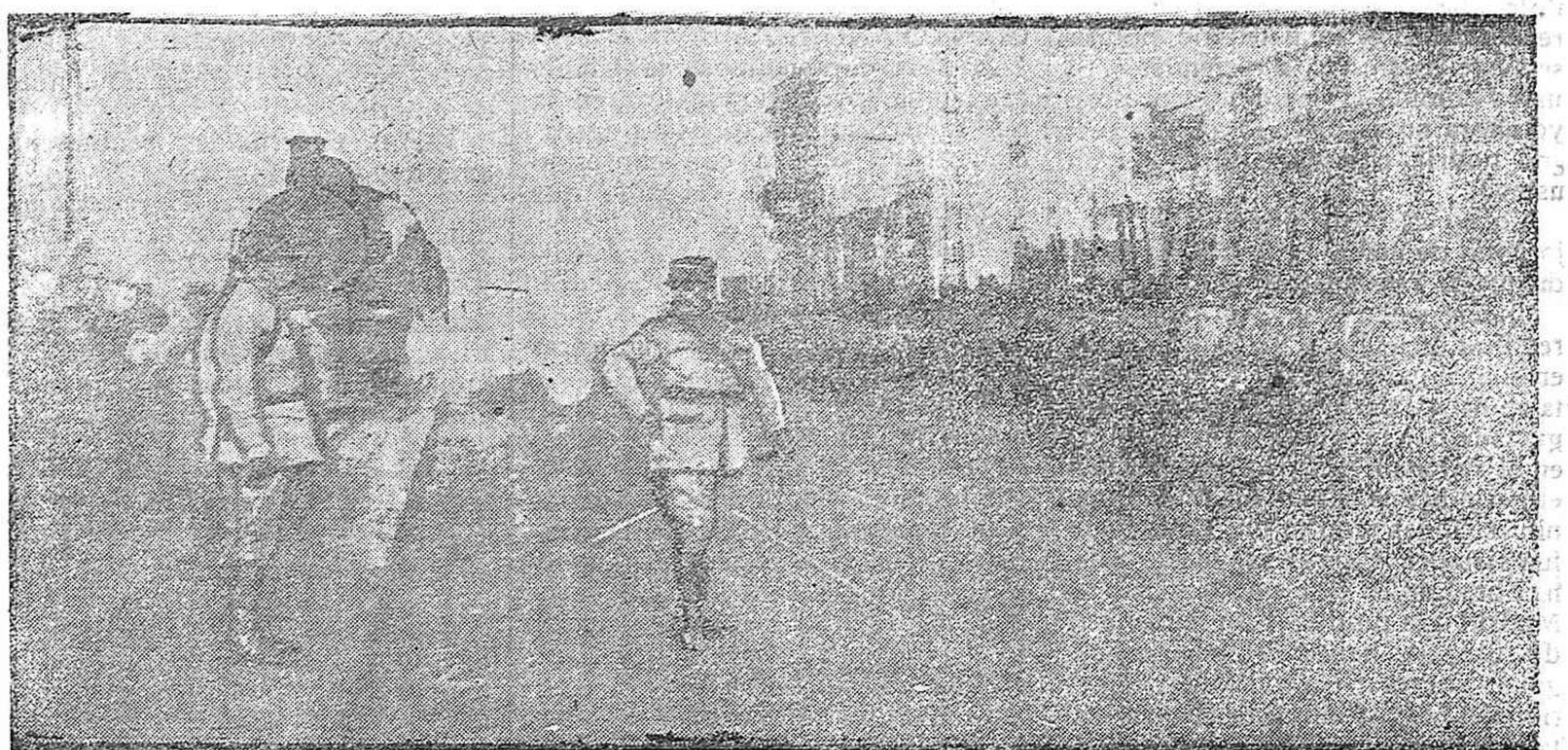
APUNTES DE LA GUERRA.—Tropas desfilando en los muelles de Salónica.

Acudid a dar la batalla al enemigo común: el acaparador, único culpable de la carestía de la vida.