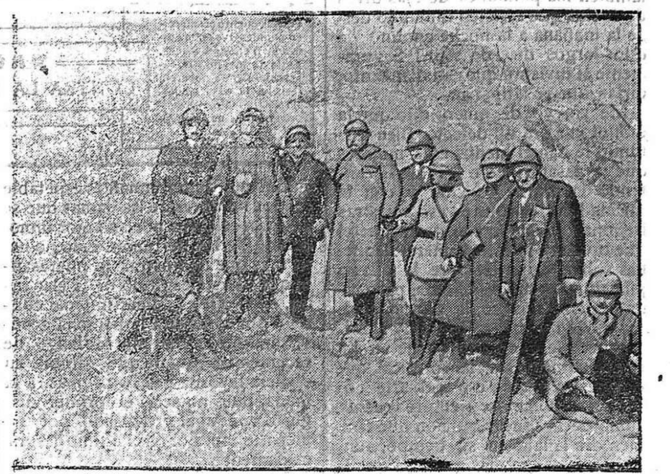
DE LA GUERRA.—Misión americana visitando un fuerte francés.

La señora regente de la Graduada de niñas, explicó a las alumnas los últimos adelantos del arte tipográfico informándolas detalladamente acerca de las máquinas linotipias y de las rotativas, demostrando la se-