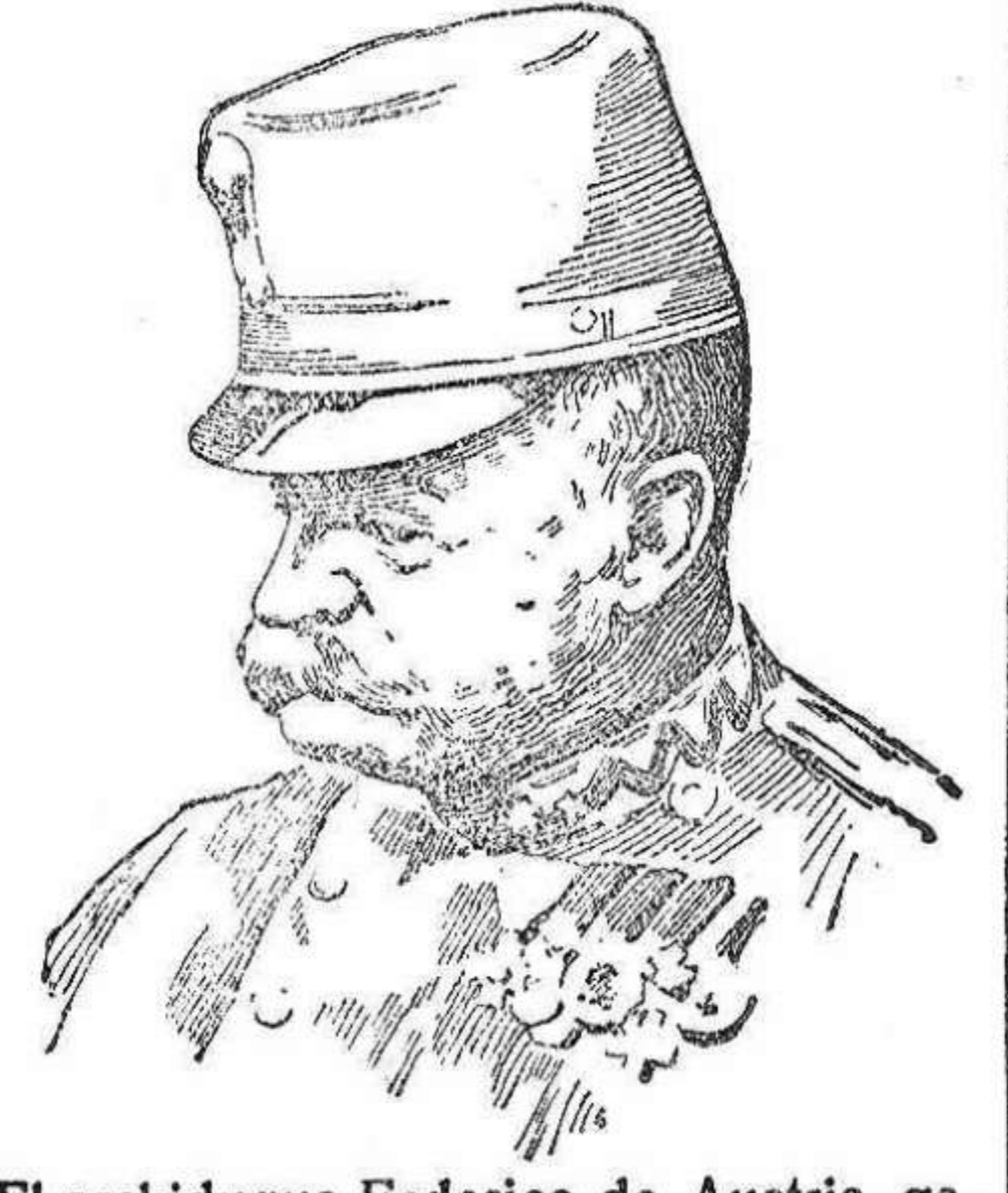
El archiduque Federico de Austria, generalísimo de los ejércitos austro-húngaros.