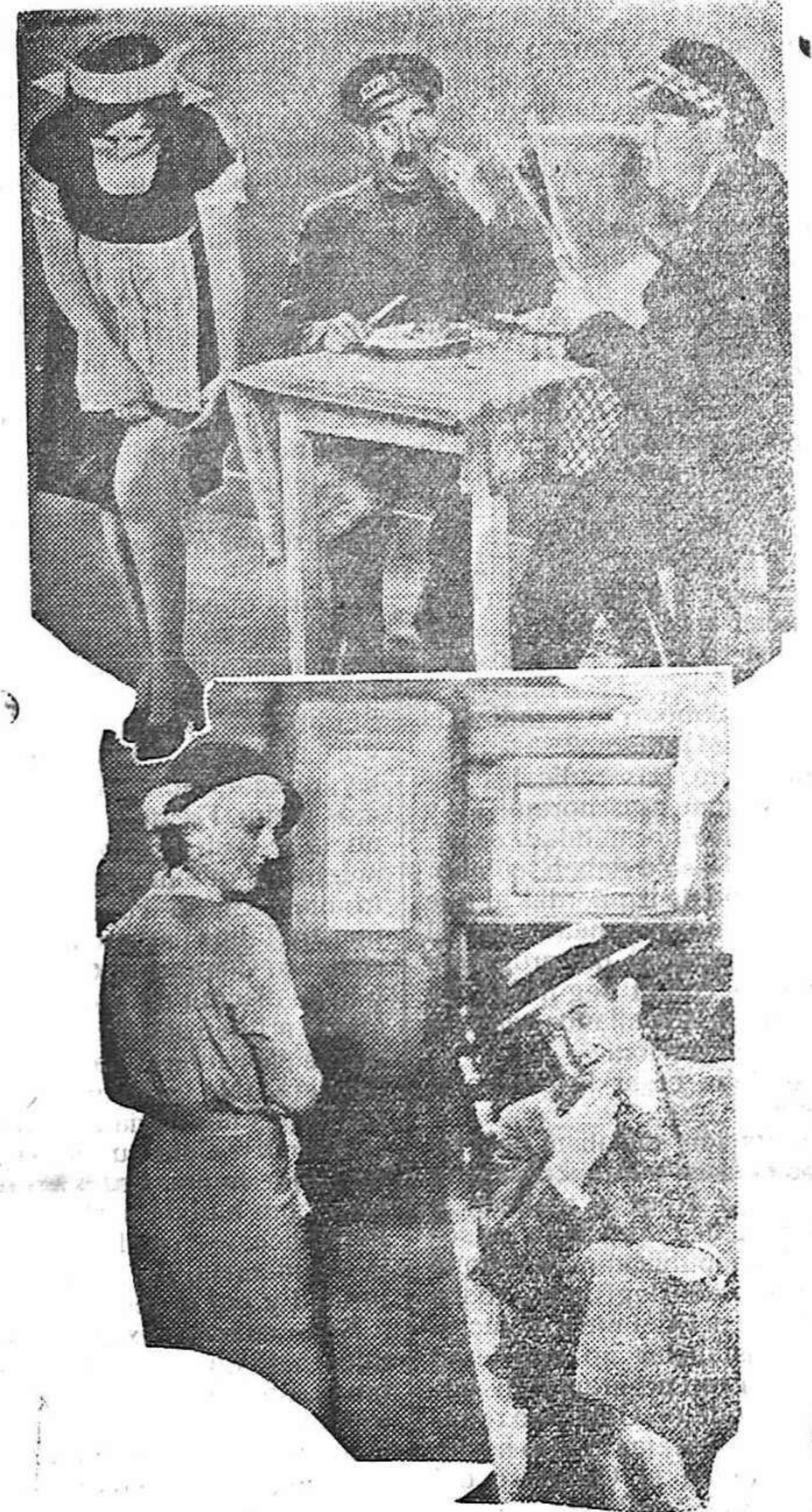
La fotografía superior representa una escena de la película «Thundering Taxis», posada por Clyde Cook y Billy Gilbert, de la Metro Goldwyn-Mayer, y dice el diálogo: LA CAMARERA.—¿No creen ustedes que la calidad de las cosas que tenemos aquí aumentará el apetito y que son baratas? EL DEL TAXIS.—Sí; debieran estar más altas.

¿Qué hubiera sucedido entonces a su país, si un científico no le hubiera devuelto «Seis horas de vida»?