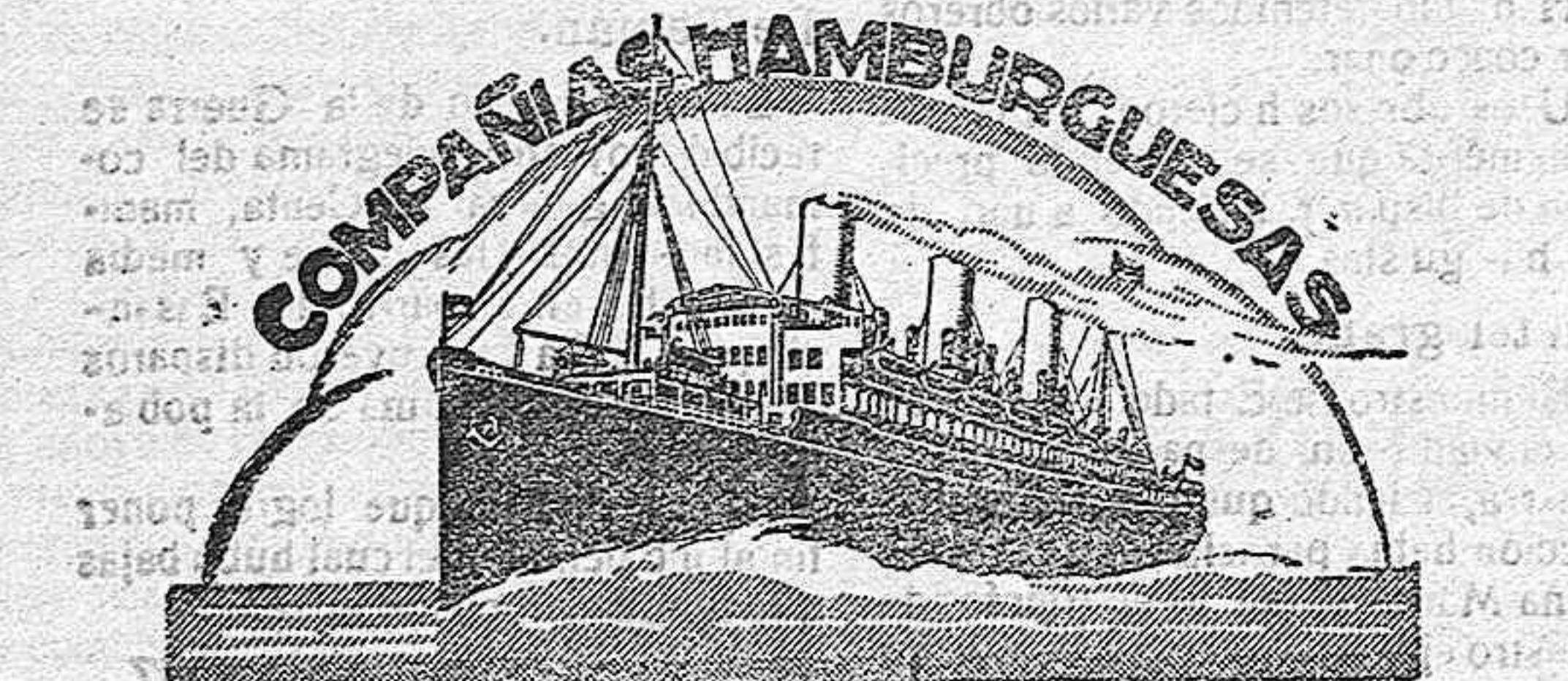
Hamburgo Sud Americana

En Madrid.—Sres. Mac Andrews & Cia, Marqués de Cubas 21.