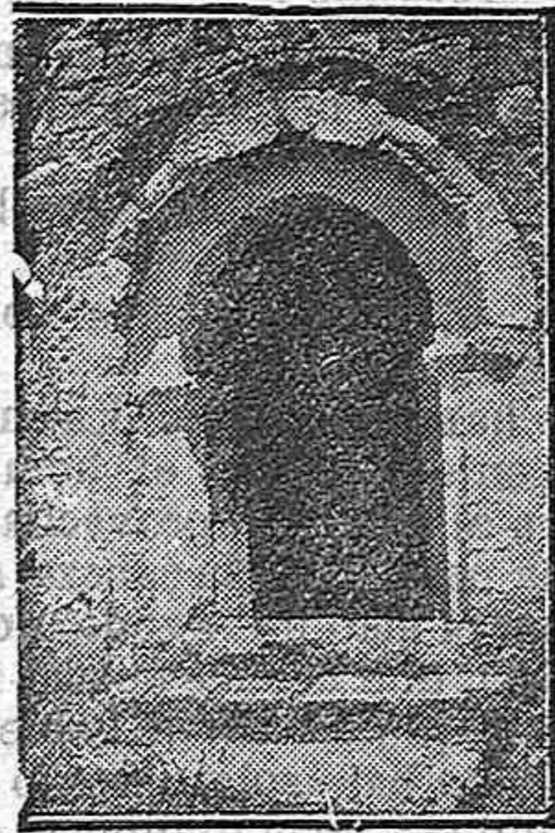
Entrada a la ermita.

Esta ermita ha sido visitada por varios monarcas; últimamente por doña Isabel II y por su hijo don Alfonso XII.