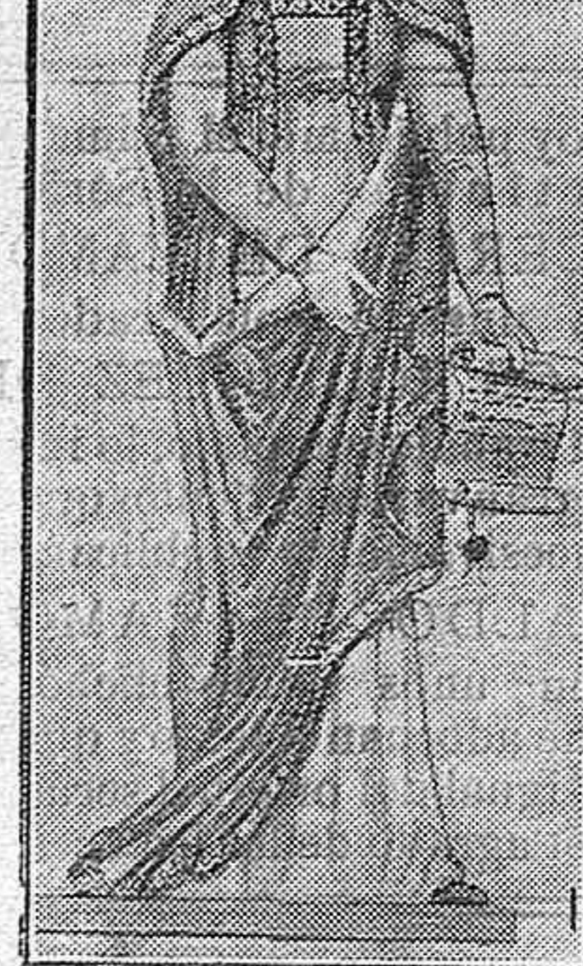
DOÑA URRACA, según una pintura de Ramón Padró, en la Diputación Provincial de Zamora. (Dibujo de C. R. Díaz.)

Los legendarios incidentes de dicho cerco y sus consecuencias fueron perpetuados principalmente por el romancero, llegando a re-