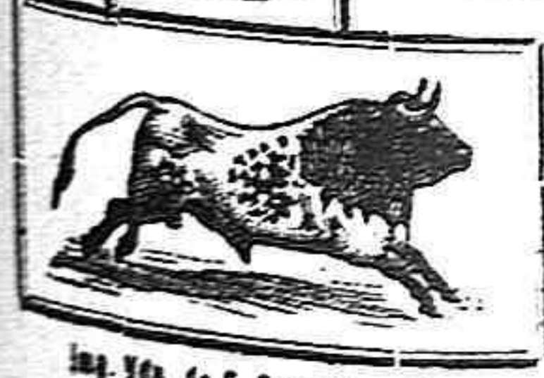
Imp. Yca. de E. Gaimita.—Zamora