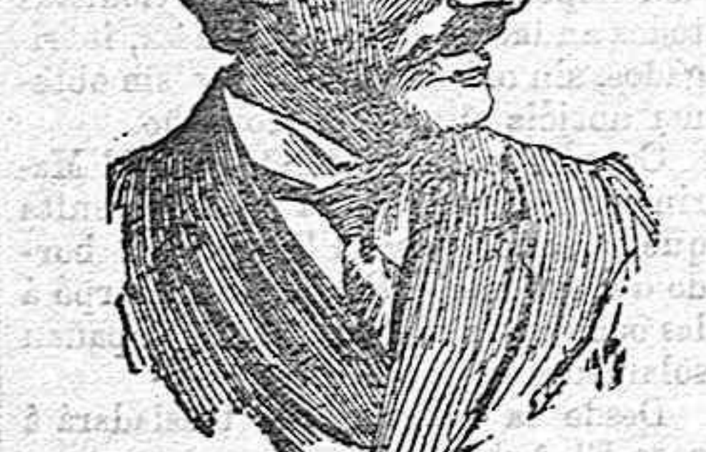
El Dr. Cook.

¿Será cierto que ambos exploradores norteamericanos han llegado hasta el Polo Norte? Peary niega que Cook le haya precedido ó adelantado en su descubrimiento, fundándose, entre otras razones, en que no ha encontrado huellas de él, ni en el Polo ni en su ruta; en cambio, Cook ha dicho: «Yo no me atrevo á decir si el telegrama de Cabo Ray (punto de Torre Neuve, desde donde fué radiotelegrafado el primer despacho en que Peary anunciaba haber llegado al Polo), es verdad ó no; mas si es cierto, yo me alegro muchísimo. En este caso, Peary habrá seguido ruta diferente á la por mí seguida, y esto es un gran honor para ambos.»