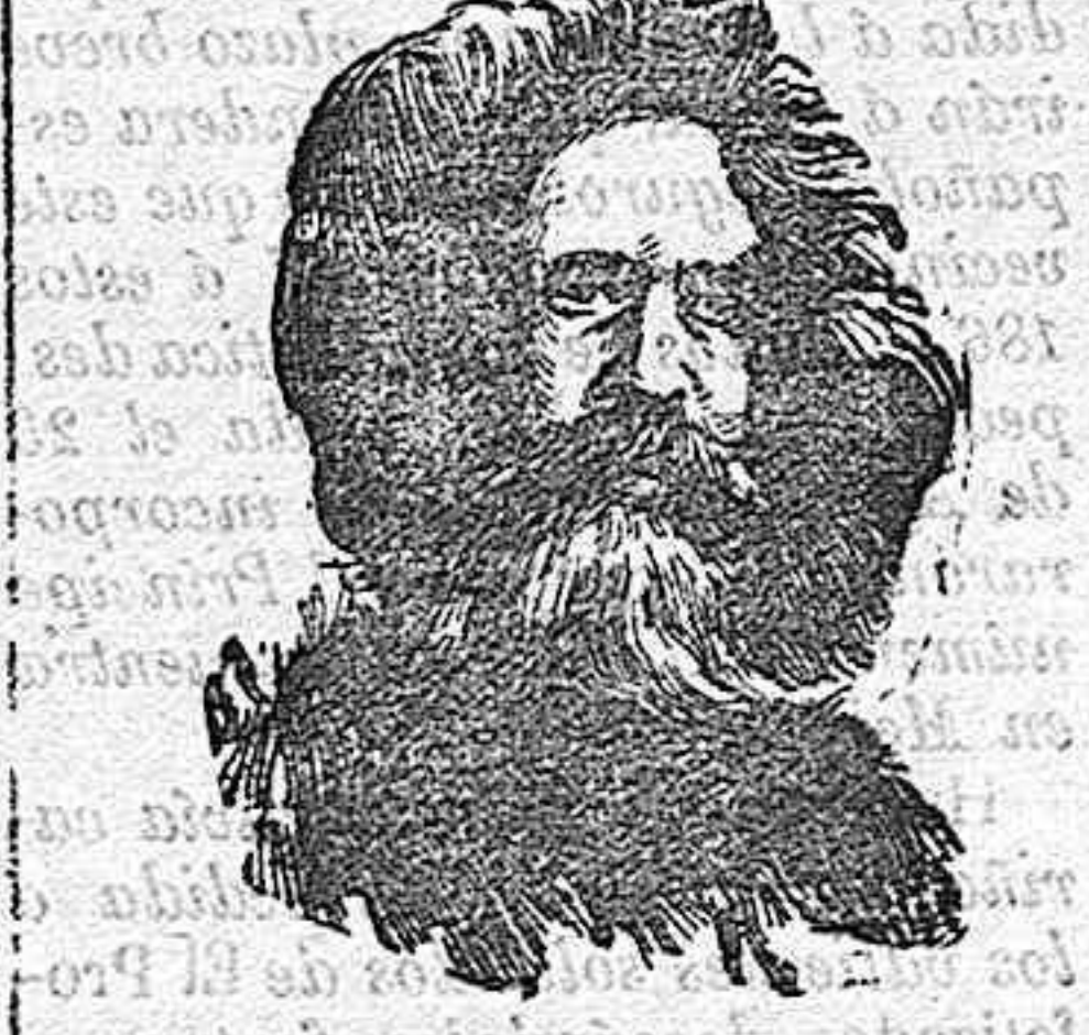
El comandante Peary.

Los exploradores afirman haber colocado la bandera norteamericana en el Polo Norte: Cook, el día 21 de Abril de 1908, y Peary, el 6 del mismo mes del año siguiente, y en vista de ello parece descartado que al primero corresponde la gloria de ser el primero que ha llegado á esa parte extrema de nuestro globo. Pero fundándose en ciertos precedentes de su historia de explorador, en las contradicciones observadas en sus relatos, en la falta de irrefutables testimonios y en el carácter imprevisto de su expedición, son más los que dudan que Cook ha conquistado el Polo, que los que creen en sus palabras.