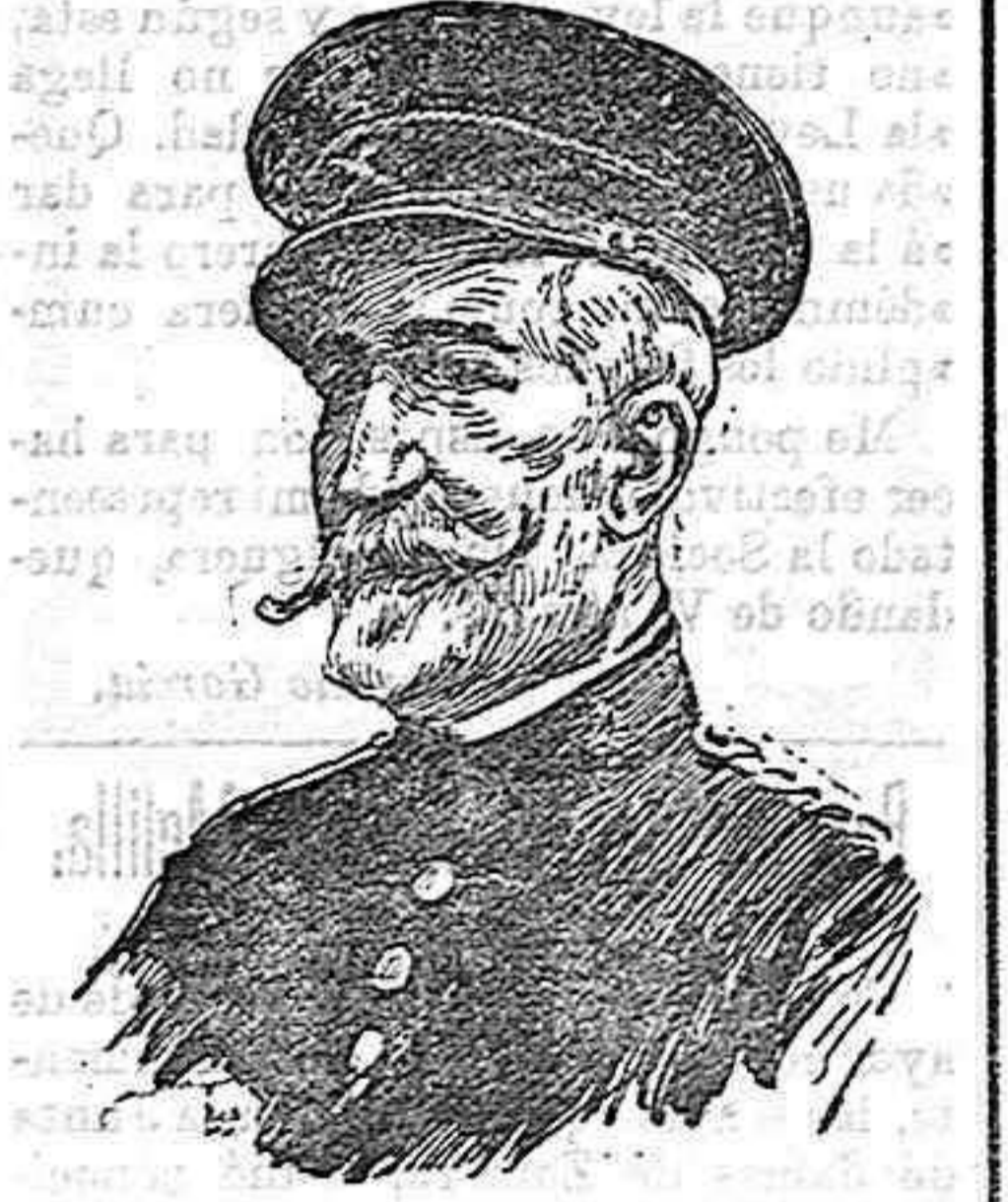
El general Arizón, gobernador militar de Melilla.

pasillo donde es imposible escribir ni hacer operación alguna. Por decoro y por necesidad se precisa que cuanto antes se arregle todo esto. En el Peñón de la Gomera.—Tiro-teo a un cañonero. Peñón de la Gomera 20 El día de ayer trancurrió en medio de la mayor tranquilidad. Por la noche inició el enemigo débil tiro-teo, que cesó a las once. A las diez de la mañana de hoy acercó el cañonero General Concha, poniéndose al habla los jefes del buque con la plaza. Los moros, desde sus posiciones del Sudoeste, tirotearon entonces al cañonero, el cual les bombardeó, retirándose luego con rumbo al Estrecho. En la plaza seguimos sin novedad, esperando con impaciencia la llegada del correo.