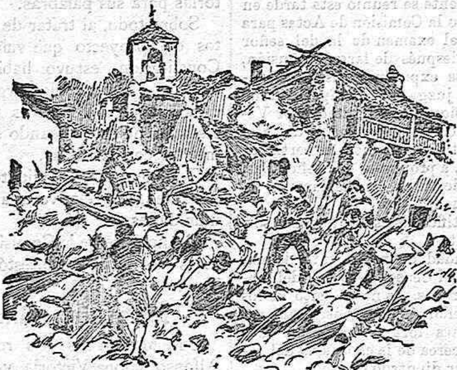
Buscando cadáveres en las ruinas de un barrio de Reggio.