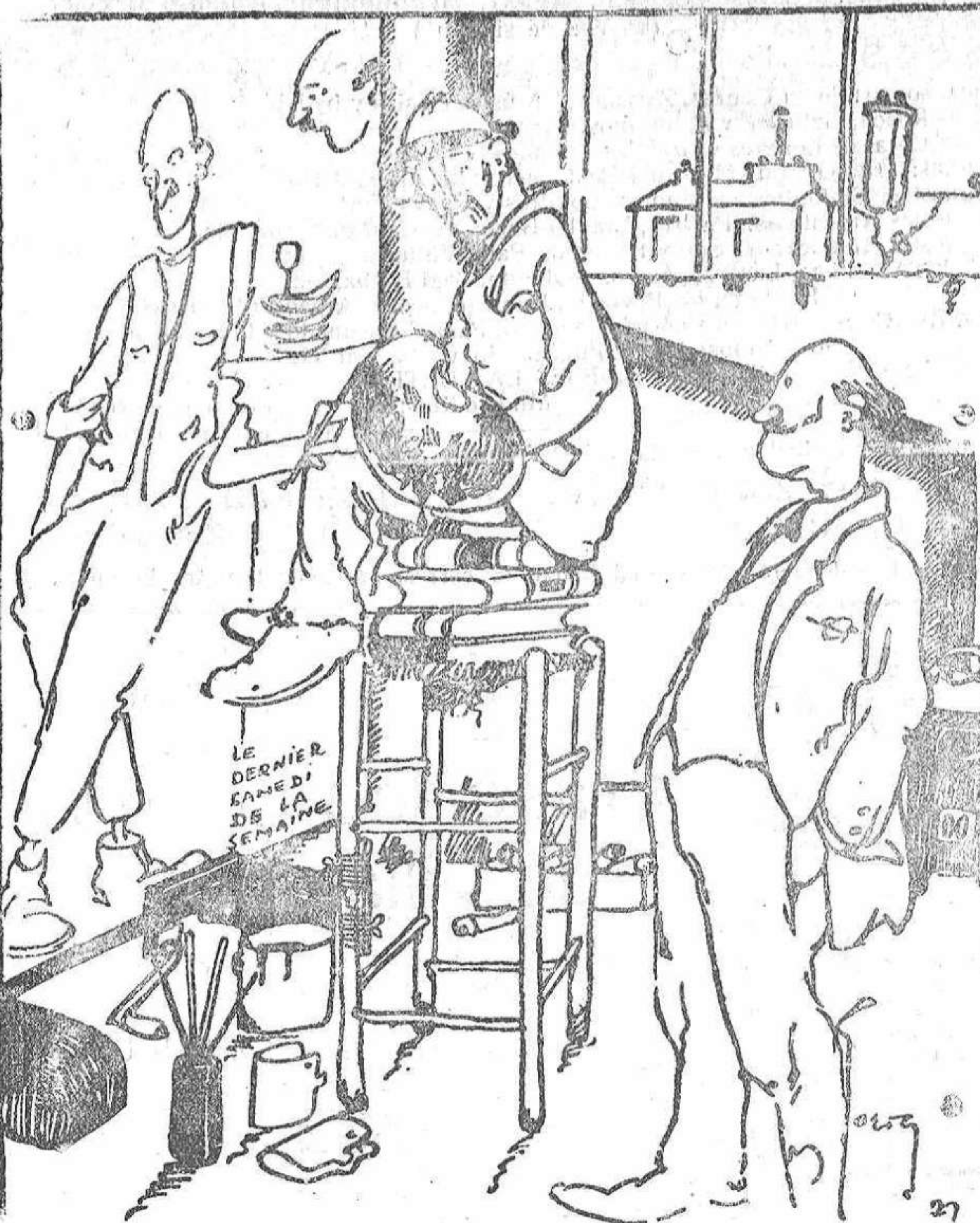
—Es el colmo, ¿qué te parece? Tengo que hacerle un retrato a este hombre y no puedo verlo ni en pintura.