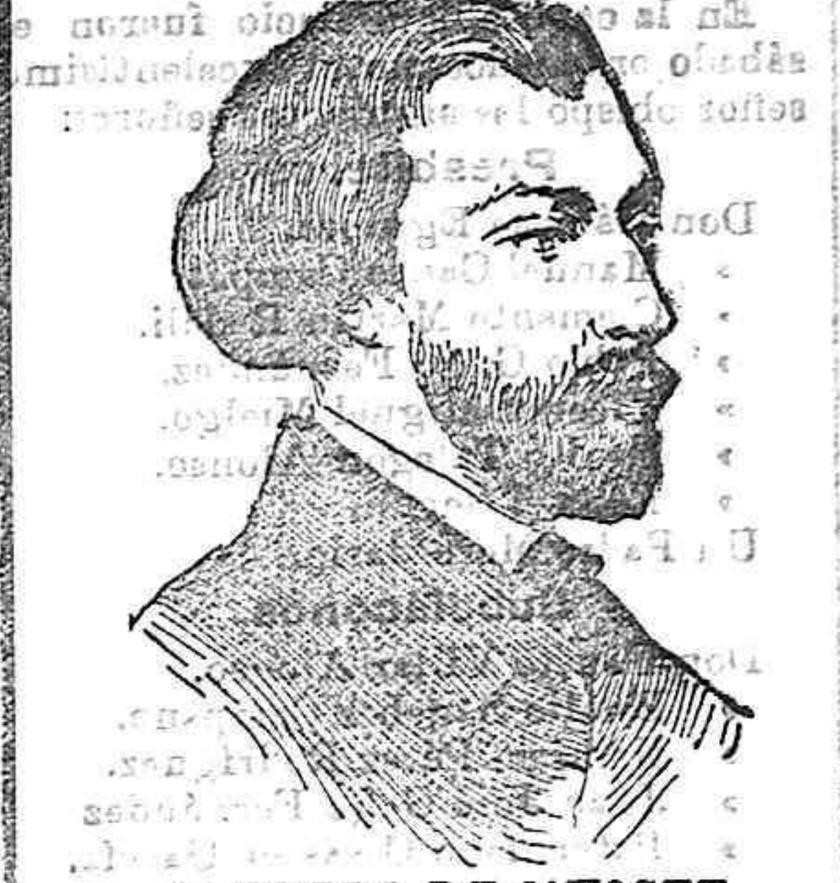
ALFREDO DE MUSSET. Siendo esto así, nada más lógico que las fiestas y solemnidades teatrales con que Francia, París, sobre todo, celebra el primer centenario del natalicio del que no sin razón ha sido llamado el caricaturista del romanticismo francés.

A juzgar por los cuatro monumentos que París ha erigido a Alfredo de Musset, el autor de tantos y tan inspirados poemas, es, sin duda, uno de sus poemas favoritos; el más querido, acaso, el mejor comprendido, indudablemente, porque al fin, sus ideas y sus ensueños, sus poesías y sus obras teatrales, parecen dictadas por el alma popular de aquella luminosa ciudad en que tanto soñó y padeció.