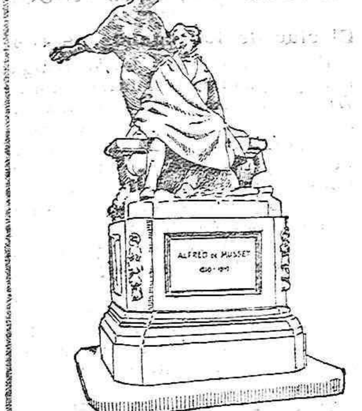
Monumento erigido a Musset delante del teatro Francés, de París.

Uno de los homenajes que hoy tributa Francia a su gran poeta, es la resurrección de sus obras teatrales. La Comedia Francesa, el teatro clásico y oficial de la vecina República, ha consagrado toda una semana a la representación de obras de Musset, alternándolas con lecturas de poesías y conferencias.