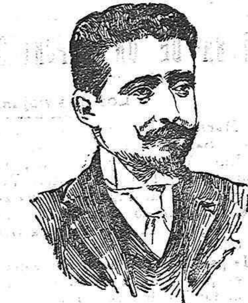
Alfonso Costa, ministro de Justicia.

El jefe de ella mandó que el personal se retirara á sus casas, no queriendo asumir la responsabilidad de alguna desgracia.