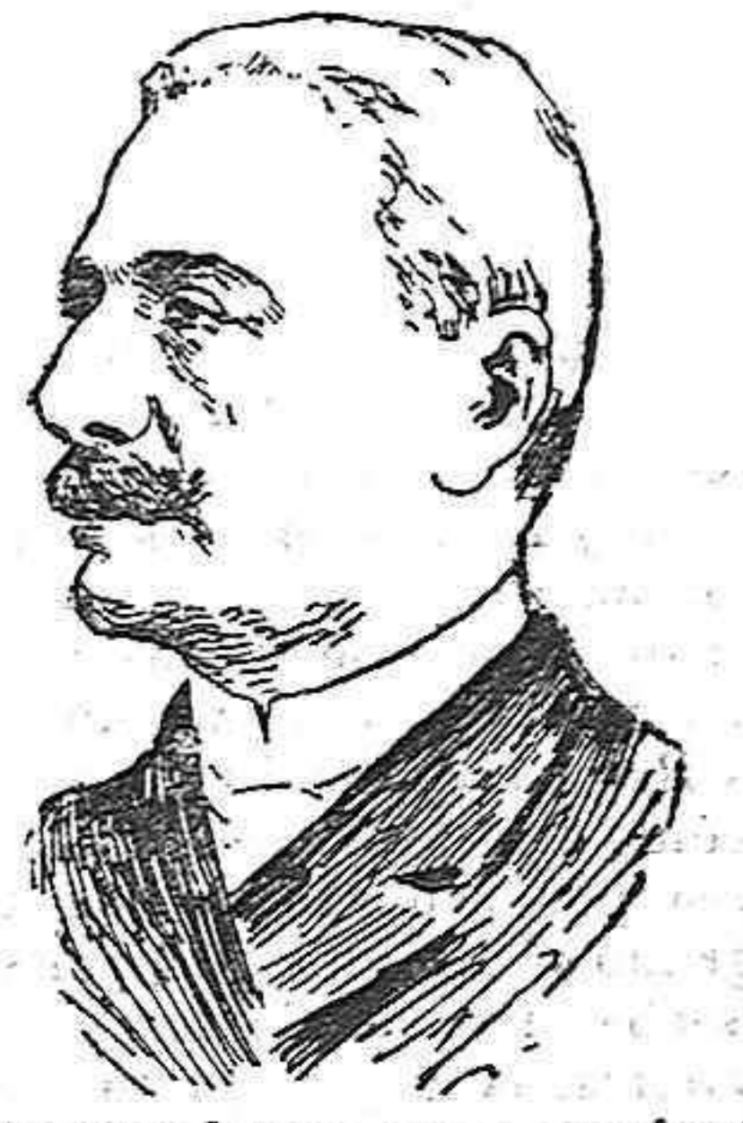
El doctor Bombarda, cuyo asesinato excitando al pueblo, fué el motivo inicial de la revolución.

En este punto embarcaron todos en lanchas de pesca, dirigiéndose á alta mar donde les esperaba el yate Amelia , á bordo del cual se hallaba desde las primeras horas del día el infante don Alfonso.