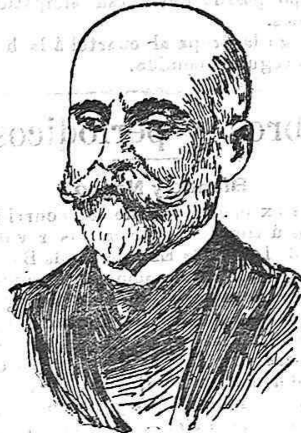
Bernardino Machado, prestigioso catedrático de la Universidad de Coimbra y ministro de Estado.

El entierro de ambos se verificará al mismo tiempo, y se proyecta tenga un carácter nacional.