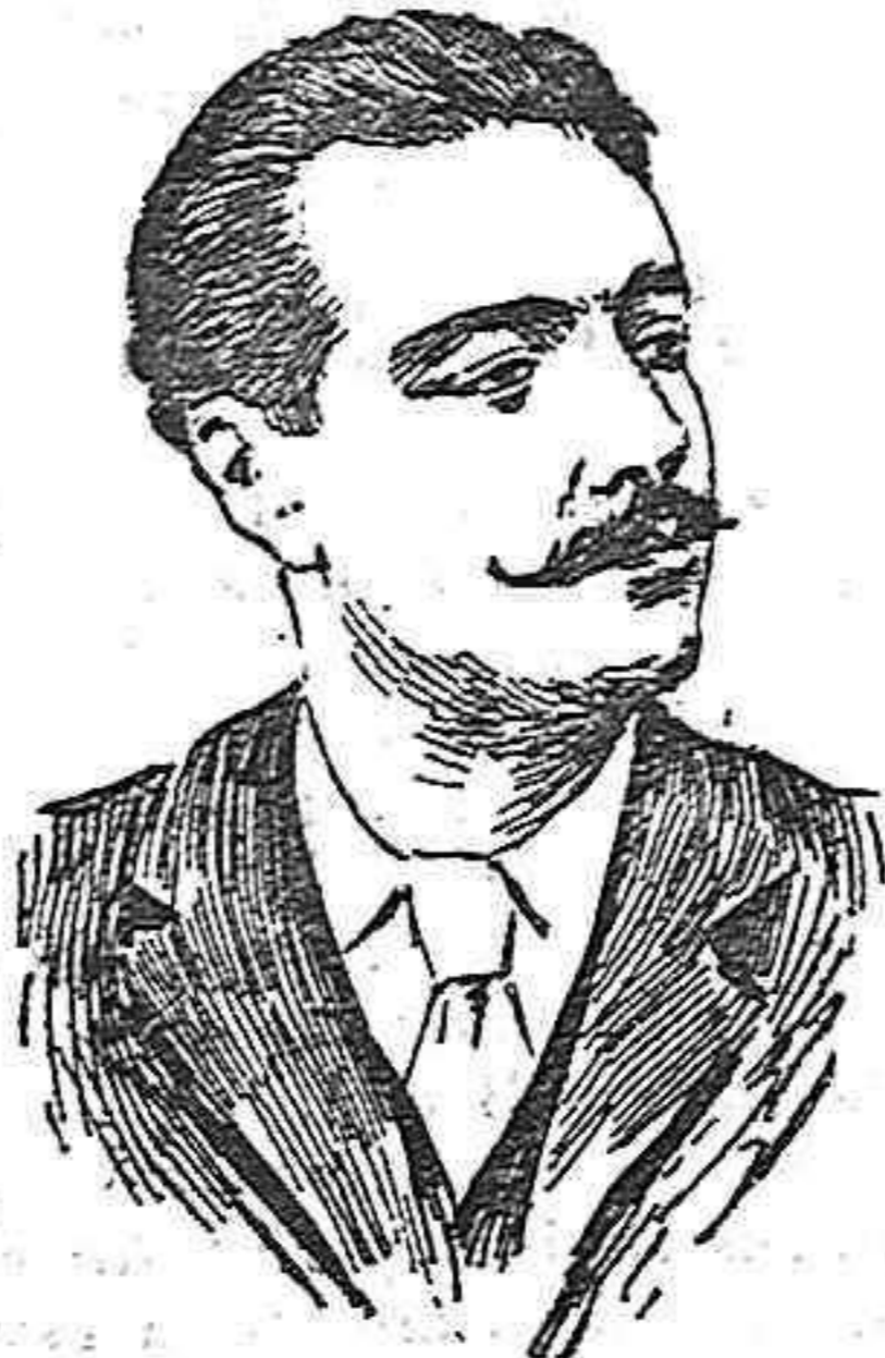
Alejandro Braga, diputado y uno de los directores de la revolución.

lanceros de caballería cargó á brida suelta, haciendo varias detenciones y ocasionando nueve heridos, que fueron conducidos por las ambulancias al hospital de San Benito. Eran las doce y media de la madrugada. En diversos parajes de la capital, sobre todo en la parte baja, donde yo vivo, notaron los vecinos gran inquietud y el rumor de grupos que corrían dando unos vivas á la República, y entonando otros La Marsellesa .