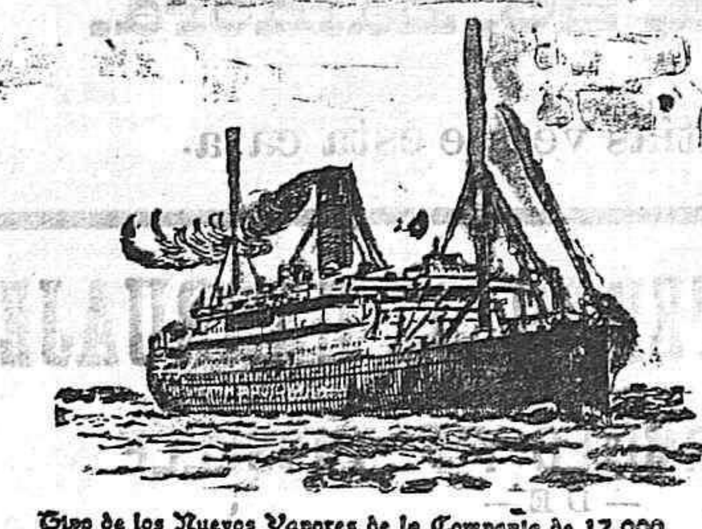
Tipo de los Nuevos Vapores de la Compañía de 12.000 toneladas. Marcha de 16 Millas.