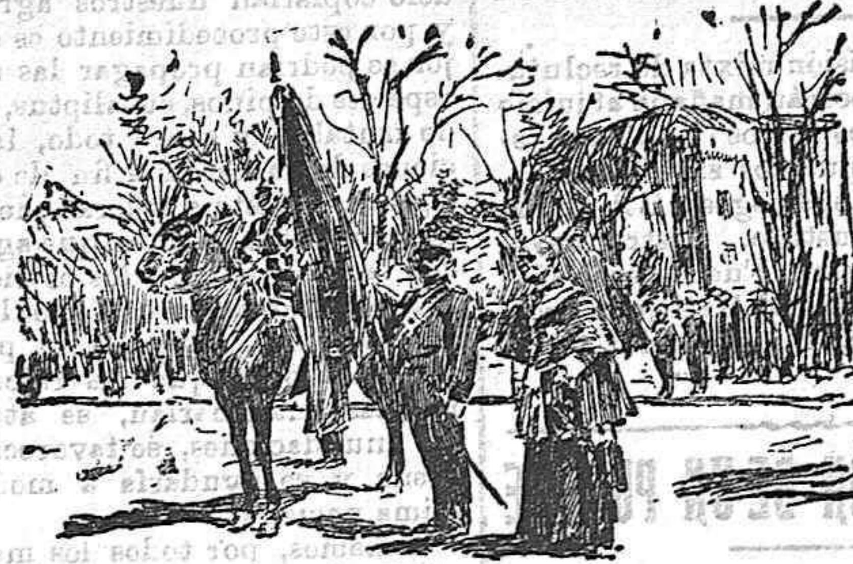
Tomando el juramento.

Ayer, y con la solemnidad de otros años, se verificó en el paseo de La Castellana al acto de jurar la bandera los reclutas de la guarnición de Madrid. Tuvo lugar a las diez y media, comen- zando el acto con una misa de campaña, que se celebró en la Glorieta del Marqués del Duero. Luego desfilaron las tropas ante los Reyes, que se hallaban en una tribuna.