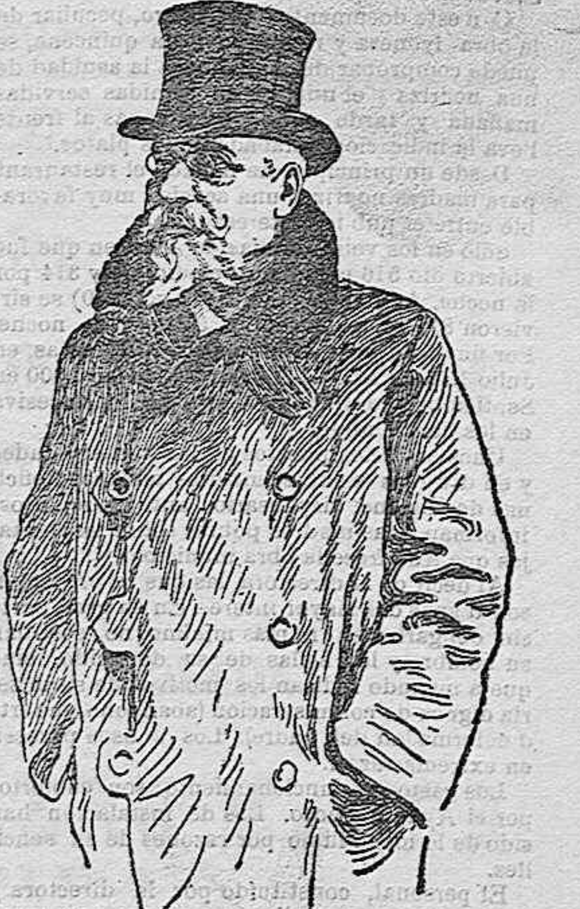
El ilustre dramaturgo D. José Echegaray, a quien como homenaje a sus talentos le ha sido otorgado el Toisón de Oro.

publicará, desde 1.º de Enero, importante información mercantil y cotizaciones de cereales en los principales mercados de la Península.