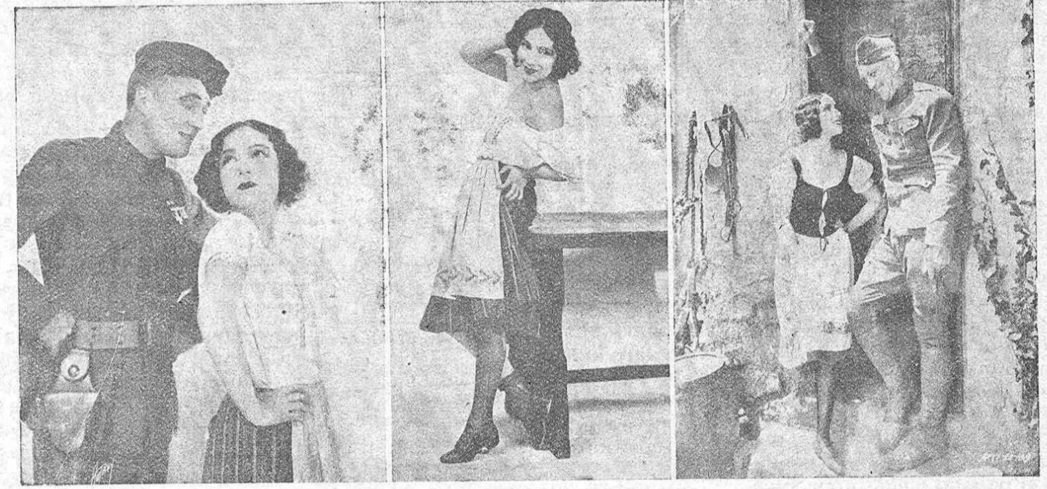
Interesantísimos episodios de la grandiosa película que se proyectará en el Teatro Principal, el 1.º de Marzo