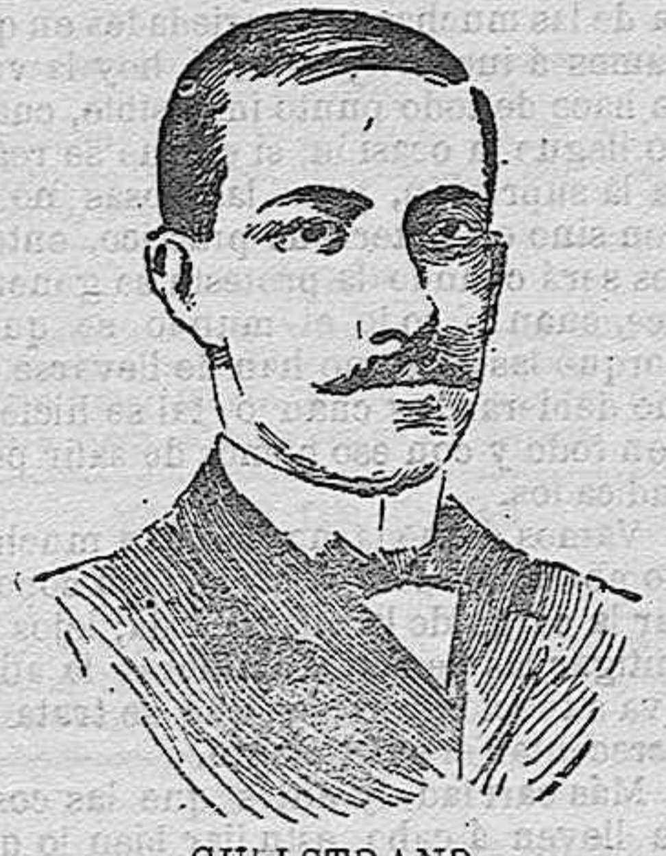
GULLSTRAND agraciado con el premio Nobel.