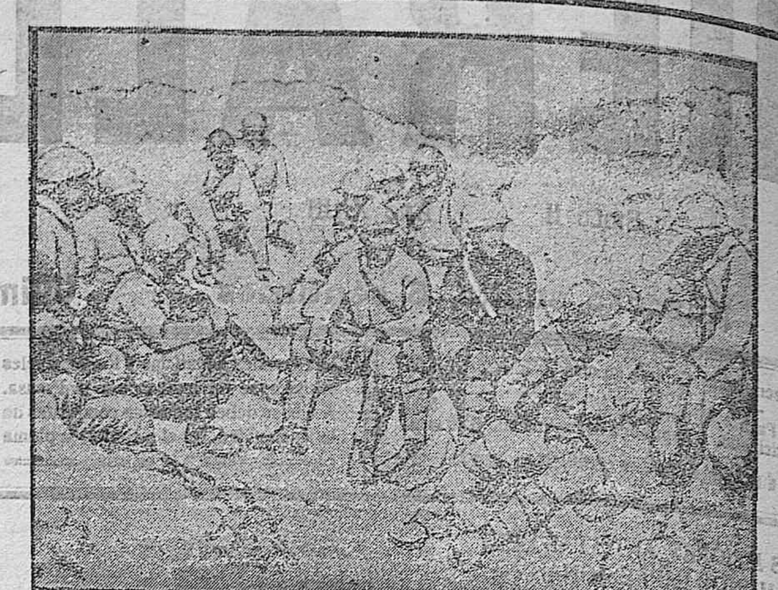
ESCENAS DE LA GUERRA.—Comiendo en las trincheras.