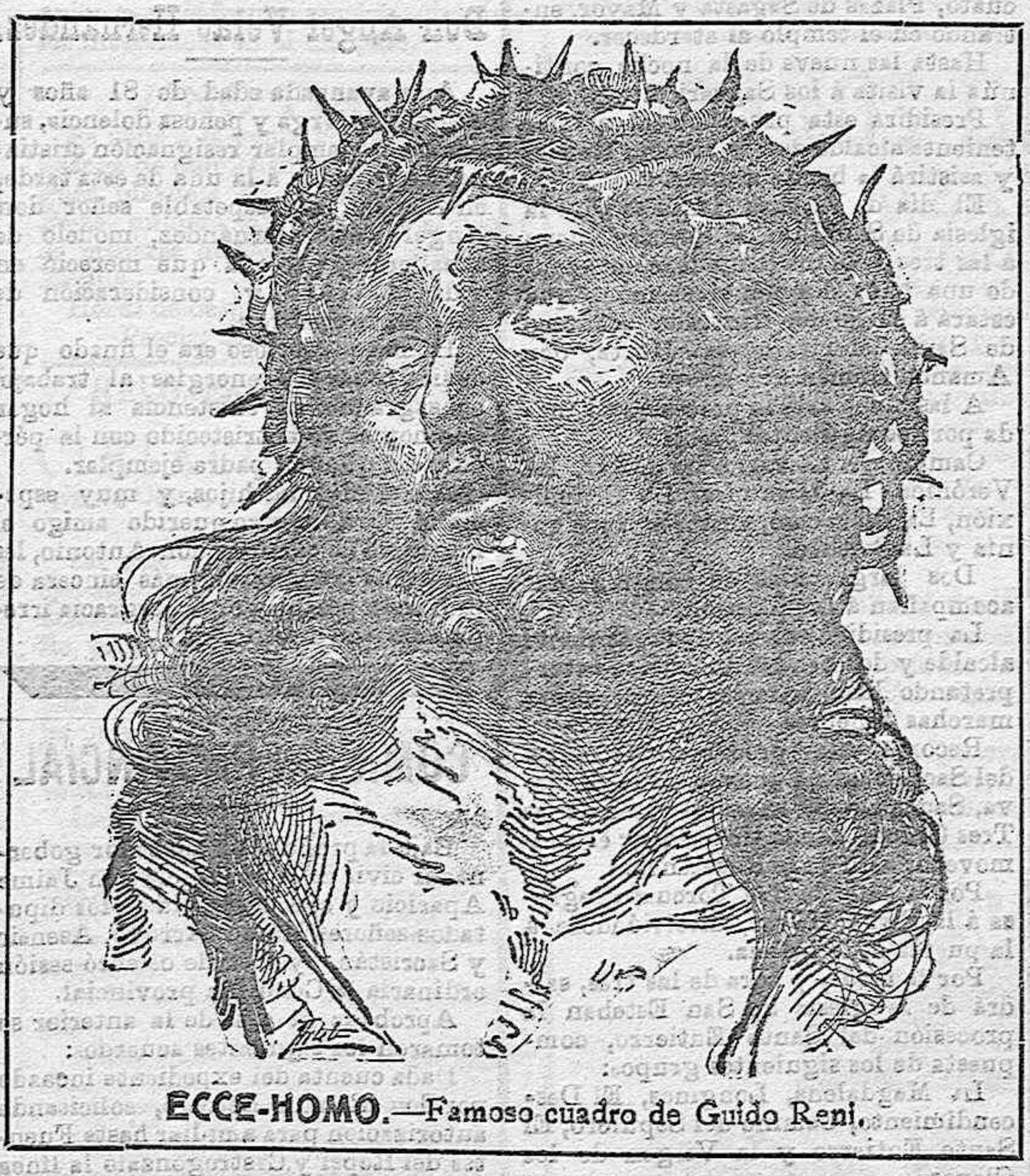
ECCE-HOMO.—Famoso cuadro de Guido Reni.