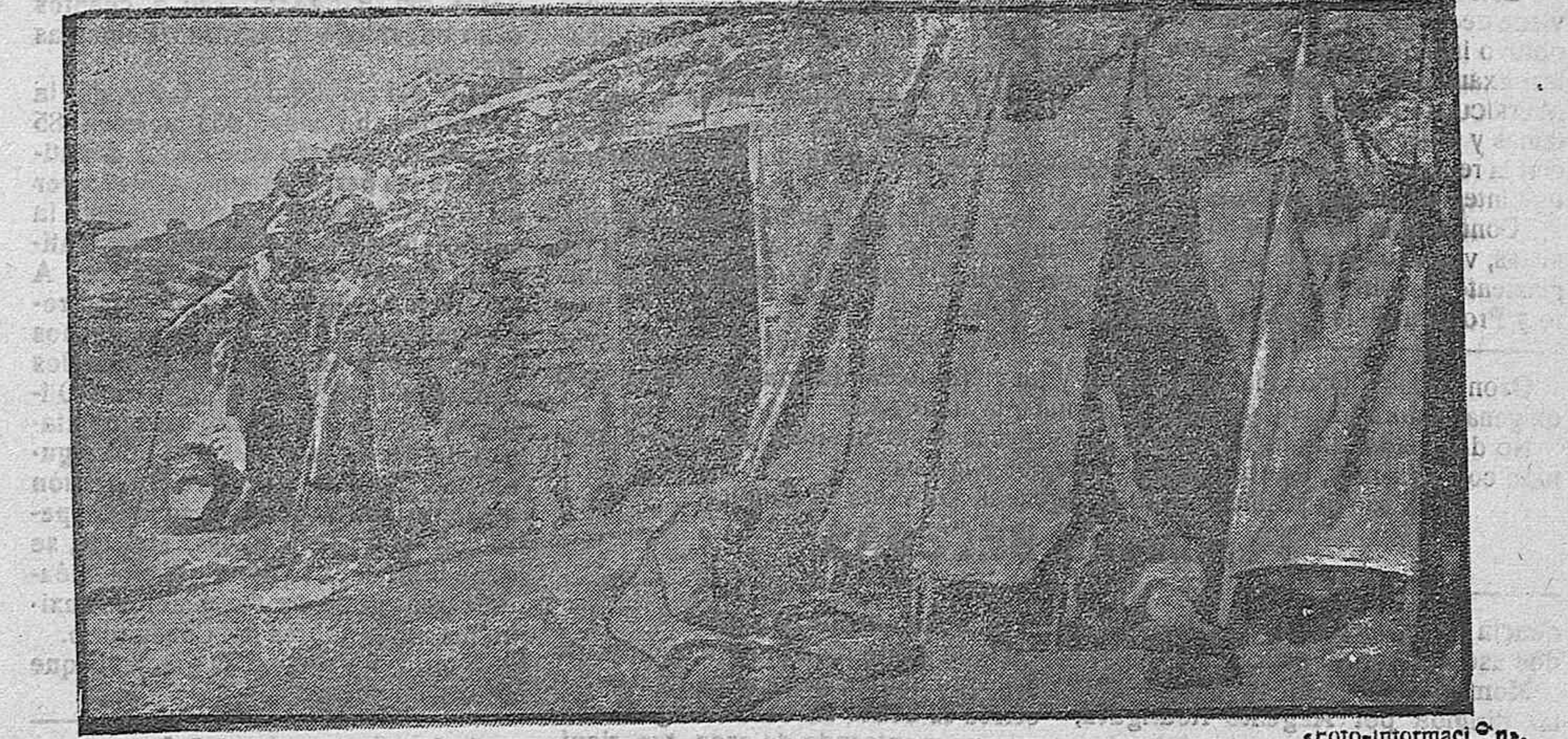
ESCENAS DE LA GUERRA.—Puesto de socorro en primera línea.

Las cosas pequeñas que tan a mal traer tienen a las gentes, sobre todo en esas ciudades donde todos sus habitantes parecen una familia grande y mal avenida, esas cosas pequeñas no