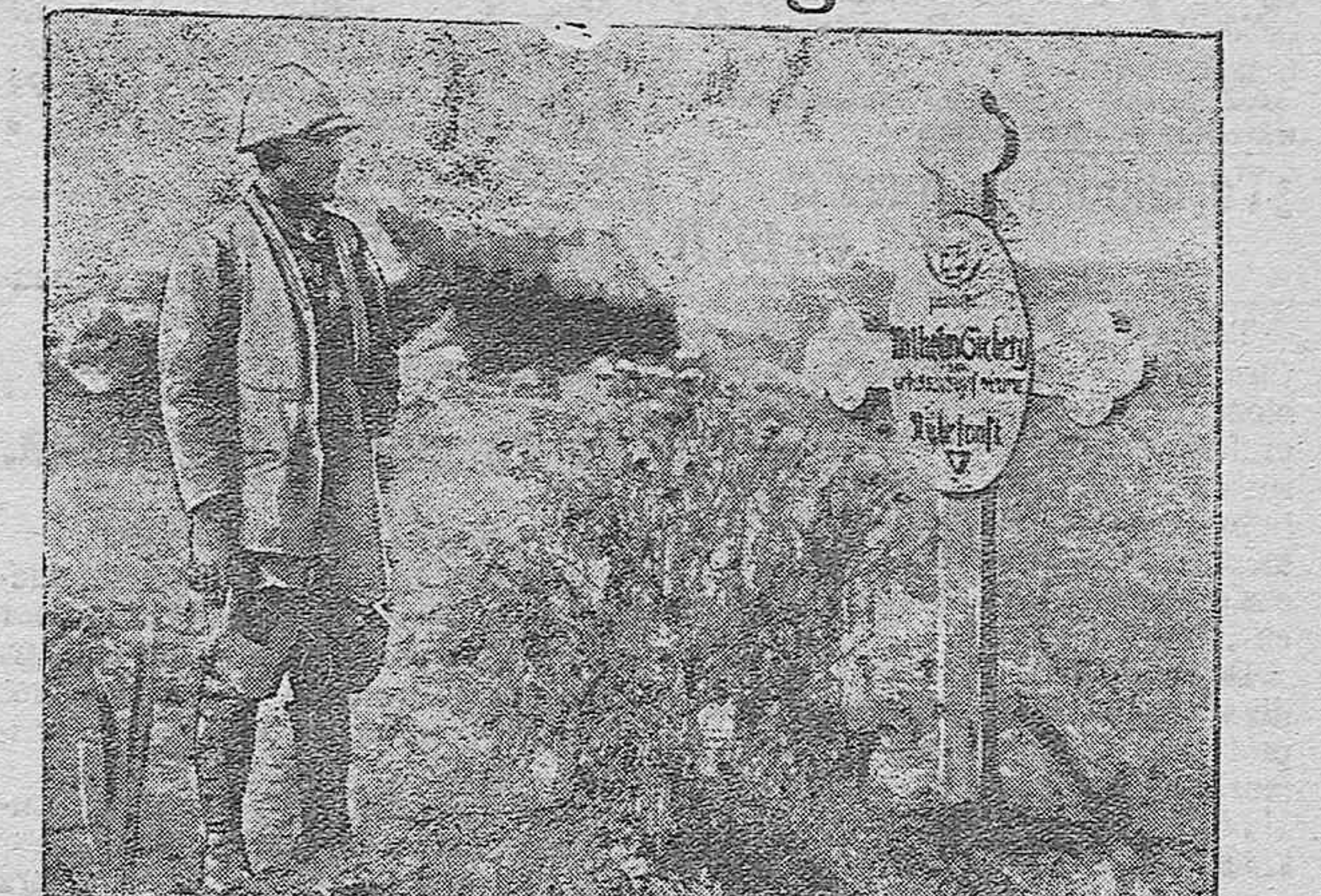
El culto a los muertos en el campo de batalla. (Foto-información.)

de sus cenizas amorosas, perfumadas por las rosas que se crían en su paz; copos de espuma a la mar; claridades y armonías al diamante que fulgura con vivisimos destellos; a la luz cambiantes bellos; a la nieve su blancura. Y concretado en un punto tanta y tanta perfección, dió forma de corazón a ese admirable conjunto; y para hacerlo fructo de Su bondad celestial vertió en su feno una rasal de Su gloria refugente y con sople omnipotente creó el amor maternal. Perfume embriagador, sentimiento peregrino, remedo de lo divino es sin disputa ese amor. Y susq se habla de con rigor mi comparación no cuadre, Dios que so lo tiene Padre al hombre llegó a envairar y se pudo humanizar para poder tener Madre. Ese desecho cumplido a quien madre el hombre llama, eso que tanto es ama, eso es lo que yo he perdido. ¡Ah, Señor! Perdón os pido por lo que voy a decir: Mucho debiste sufrir, fué sin tala el padecer, más no llegaste a ver a vuestra Madre morir. Es la fuerza del dolor que en su terrible oleaje dicta al alma ese lenguaje de incomprendible aargor. La madre es aliento, amor, a'ma, vida, sentimiento, ventura, paz y contento; y al perseria, perdí calma, paz, contento, dicha y alma amor, ventura y aliento. JUAN SIMARRO GONZALEZ.